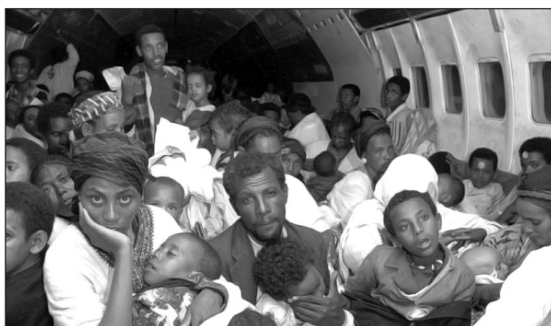
Immigrants en provenance d'Éthiopie en route vers l'État d'Israël, 1991