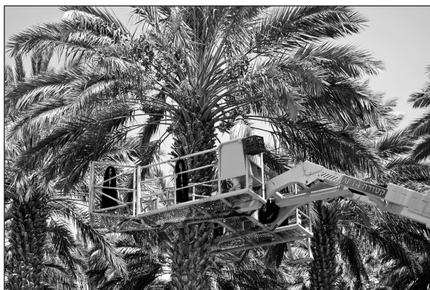
Cueillette de dattes en Israël