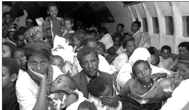
Immigrants from Ethiopia on their way to the State of Israel, 1991