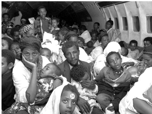
(ፎቶ፦ ናታን አልፈርት)

לא לכתוב באזור זה لا تكتب في هذه المنطقة