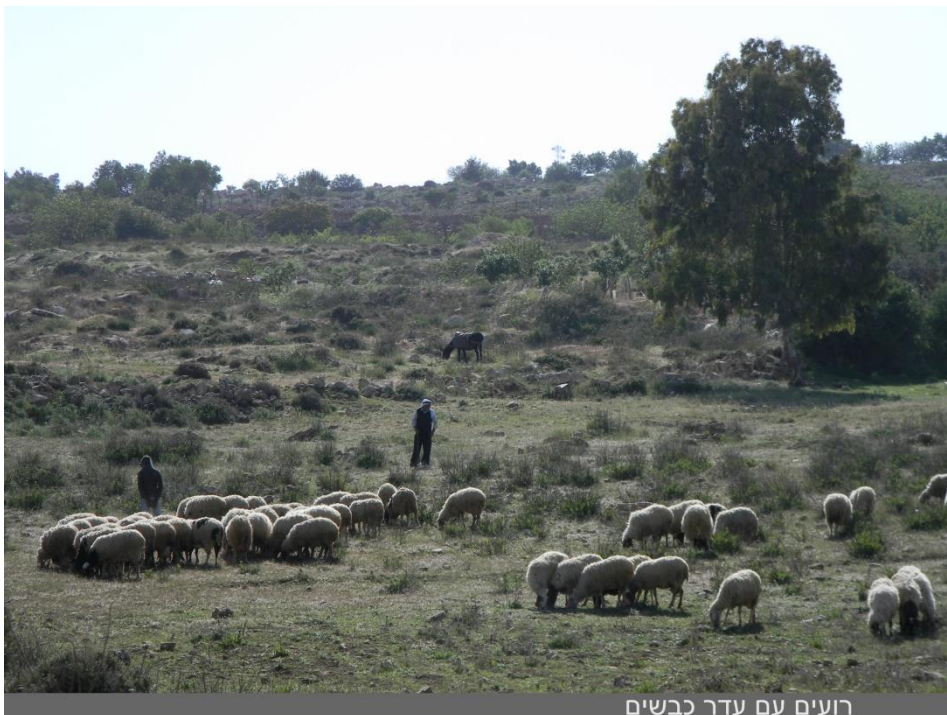
רועים עם עדר כבשים