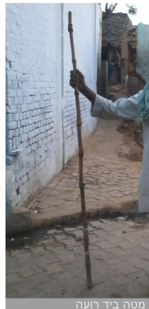
מטה ביד רועה