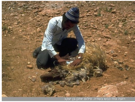
רועה גוז כבש בשדה.