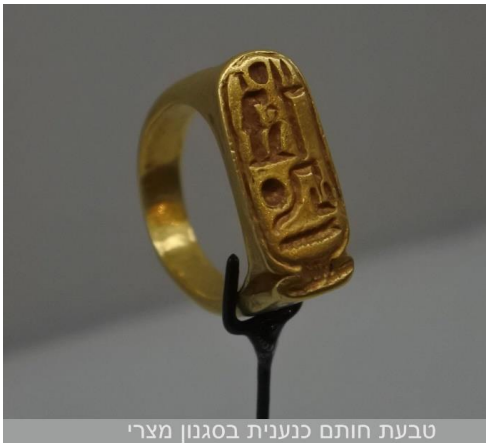
טבעת חותם כנענית בסגנון מצרי