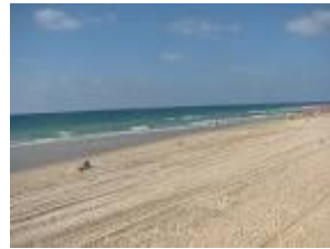
חול אשר על שפת הים