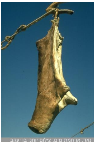
נאד, או חמת מים.

נביא המחשה או תמונה של "חמת מים", ונסביר מהו. נאד=שק עור למים, כמו מימייה גדולה.