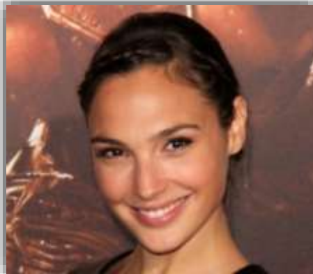
גרטה טונברי (פעילה סביבתית)