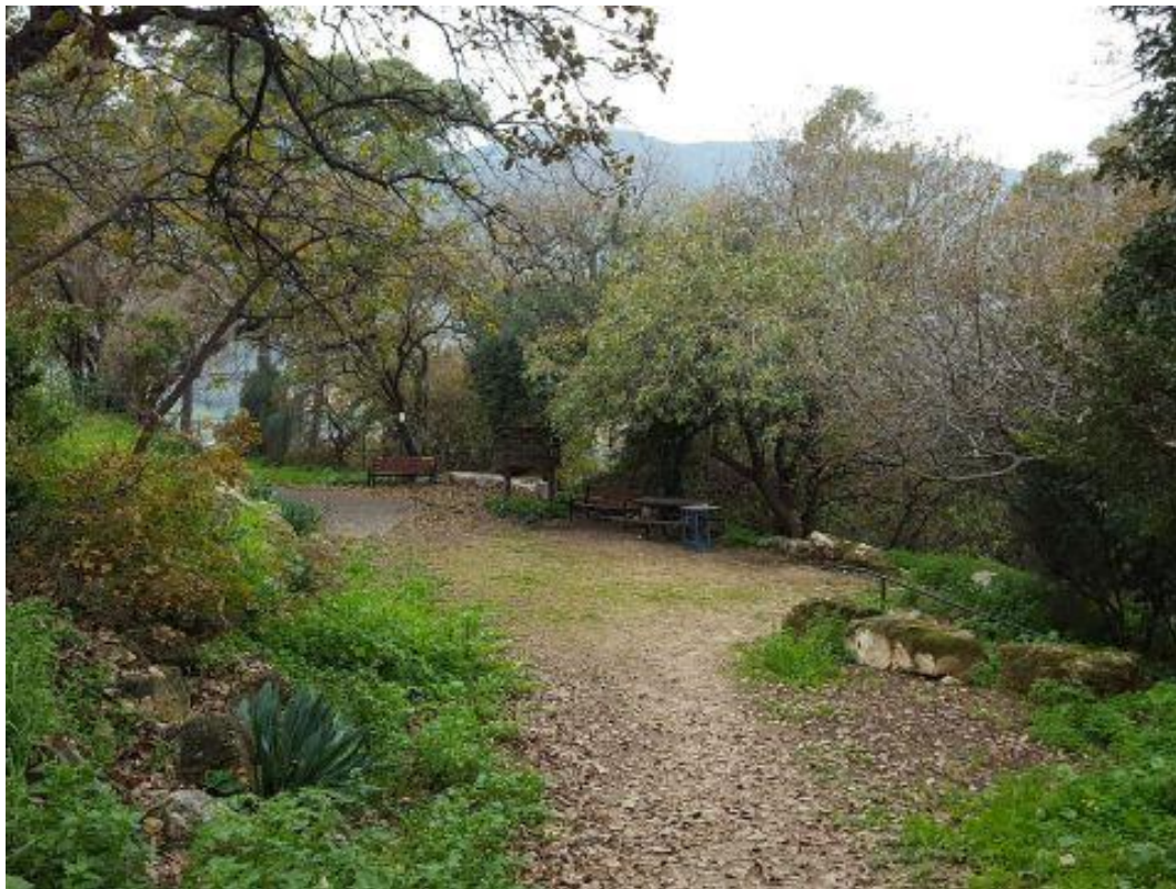
בתמונה: הגן הבוטני באורנים

עיצוב אפליקציה המיועדת להעברת מידע והסבר על מבנה הגן ועל הצמחים, מפות על, מסלולים וחלקות שונות המיועדות ללמידה