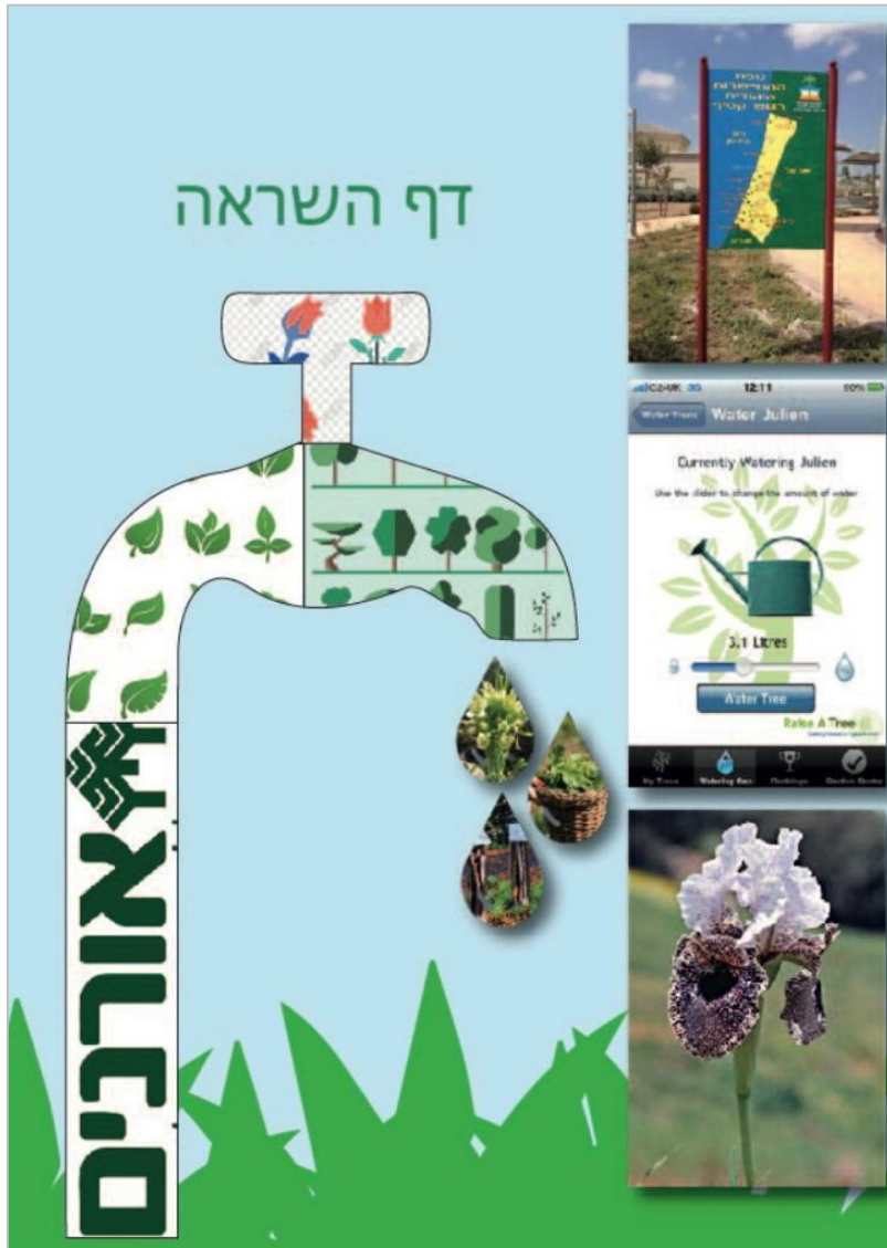
בתמונה: דף השראה