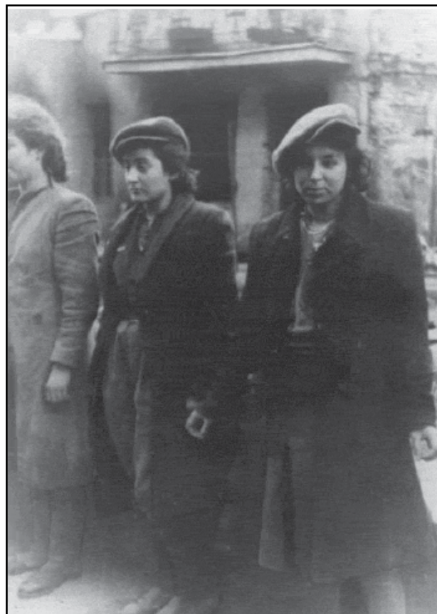
לוחמות יהודיות שנתפסו בידי הגרמנים