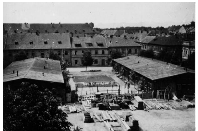
גטו טרזיינשטאט (טרזין) במראה כללי