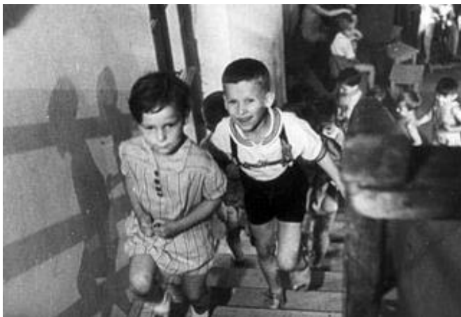
בית ילדים בגטו. טרזיינשטאט, צ'כוסלובקיה

באוקטובר 1941 הוקם גטו טרזיינשטאט, בו רוכזו יהודי צ'כיה. גם שם הירש שמר על רוח הספורטאי ולמרות התנאים הקשים, דגל בחינוך הילדים לשמירה על ניקיון ולפעילות גופנית. אמונתו הייתה כי גם בתנאים הקשים ביותר יש לשמור על צלם אנוש. הוא עשה הכל כדי לשפר את חייהם של ילדי הגטו. הוא התעקש שהילדים יתאמנו וישחקו בכל יום בגטו, כי ראה בפעילות ספורטיבית את הדרך היחידה להישרדותם. ביולי 1942 בנה הירש בגטו, תוך שהוא עומד מול שלטונות הגטו הגרמנים ובאופן בלתי יאומן מצליח לשכנעם, מגרש אימונים ומשחקים עבור ילדי ונערי הגטו שהתאמנו שם ושמרו על אורך חיים ספורטיבי וגופני באופן יחסי למצב התנאים הנוראי שהתחולל בגטו. פעילויות הספורט בגטו נודעו למרחקים והגרמנים הניחו להירש להמשיך בפעילות כאשר ניסו להציג את גטו טרזיינשטאט כ"גטו לדוגמא". בקיץ 1943 הוקם מחוץ לטרזיינשטאט מחנה צריפים, אליו שולחו 1,200 מילדי גטו ביאליסטוק בדרכם לאושוויץ. על אנשי הגטו נאסרה הגישה למחנה זה. מצב הילדים במחנה עורר את דאגתו של הירש, והוא החליט להיכנס למקום על אף האיסור. לאחר כניסתו הוא נתפס ונאסר לחודש. בספטמבר 1943, לאחר שריצה את מאסרו, גורש לאושוויץ.