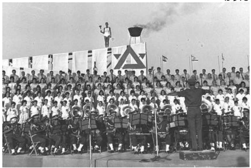
מנגנים את התקווה בפתיחת המכביה ה-6 1961