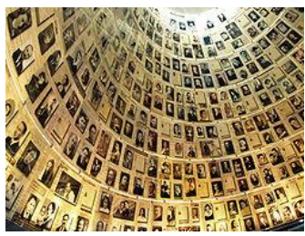
היכל השמות ביד ושם

בתחום החקיקה: בשנים הראשונות לקיומה של המדינה חוקקה הכנסת את החוק לעשיית דין בנאצים ובעוזריהם תש"י-1950. חוק מיוחד זה הקנה סמכות שיפוט למדינת ישראל על פשעי הנאצים ועוזריהם, שבוצעו מחוץ לתחומה, בתקופה שקדמה לכינונה של המדינה כלפי אנשים שלא היו אזרחיה. החוק הוא רטרואקטיבי (נחקק על עבירה שבוצעה לפני מועד החקיקה) 14 , חוק זה מבטא את היותה של מדינת ישראל נציגת העם היהודי ומבטא היבט לאומי. על פי חוק זה הועמדו אדולף איימן ואיוון דמיאניוק למשפט בישראל.