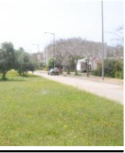
היישוב קציר - חריש הוא מועצה מקומית במחוז חיפה בסמוך לנחל עירון

נציין כי בית המשפט קיבל שיש לקבוצות מיעוט כמו חרדים, בדואים וכדומה זכות להקים יישוב המיועד רק לבני קהילתיהם, כדי לסייע להן לשמר את תרבותן הייחודית מול קבוצת הרוב הדומיננטית, אך קבע כי לקבוצת הרוב היהודי אין הצדקה להגנה תרבותית, כי לא מדובר בקבוצת מיעוט או בקבוצה תרבותית ייחודית במדינה.