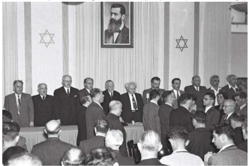
שרים התקווה בעת ההכרזה על הקמת המדינה 1948

שערו מהי התחושה המשותפת לכל אלה העומדים דום ושרים את המנון "התקווה"