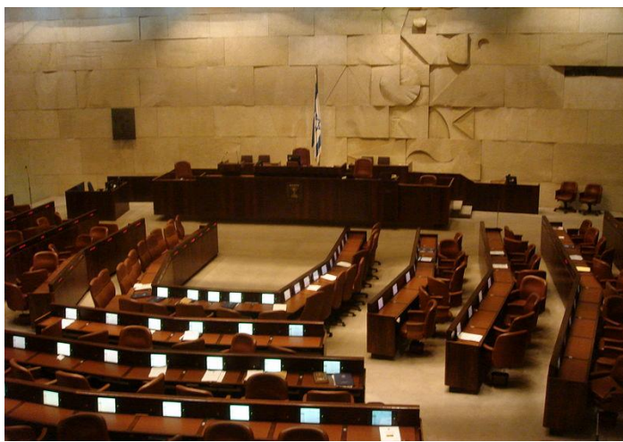
אולם מליאת הכנסת

מדינת ישראל אימצה בסמליה: בדגל המדינה, בסמל המדינה ובהמנונה תרבות יהודית מובהקת.