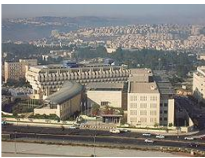
משרד החוץ ובנק ישראל בקריית הממשלה

חוק יסוד ירושלים בירת ישראל קובע כי העיר ירושלים היא בירתה של מדינת ישראל. חוק יום ירושלים, תשנ"ח - 1998