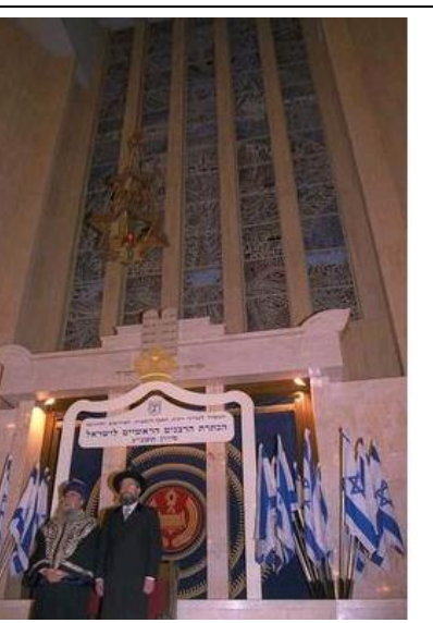
הכתרת הרבנים הראשיים אליהו בקשי דורון והרב ישראל לאו בפתח "היכל שלמה, בירושלים משכנה של הרבנות הראשית. ©לע"מ הצלם אבי אוחיון 1993.

החוק מסדיר את חלוקת התפקידים בין שני הרבנים הראשיים. כל אחד מהרבנים בתורו מכהן במשך מחצית מתקופת כהונתו כנשיא בית הדין הרבני הגדול, ובמחצית האחרת – כנשיא מועצת הרבנות הראשית. הרבנים חייבים להתחלף ביניהם בתפקידים. בתקופת הכהונה אסור לרב האחד להתערב בתפקודו של האחר. הצעות