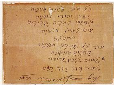
הבית הראשון והפזמון של השיר "תקוותנו" בכתב ידו ועם התימתו של נפתלי הרץ אימבר, תרס"ח-1908

כל עוד בלבב פנימה נפש יהודי הומיה ולפאתי מזרח קדימה עין לציון צופיה. עוד לא אבדה תקותנו, התקווה בת שנות אלפים, להיות עם חופשי בארצנו ארץ ציון וירושלים.