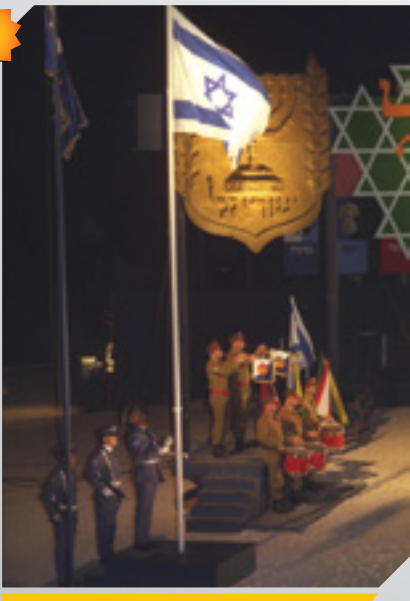
הנפת הדגל לחצי התורן, הר הרצל, 06/05/1992.