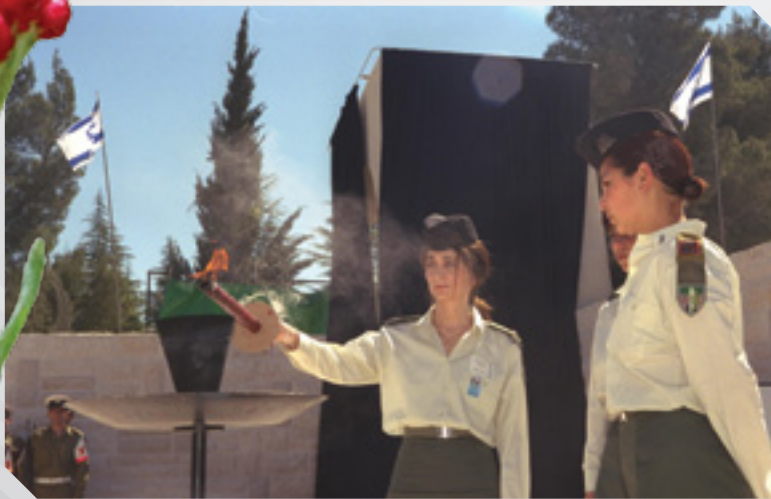
שתי חיילות מדליקות את המשואה בהר הרצל, 30/4/1998, צלם: עמוס בן גרשום, לע"מ.

וְאִיךְ עוֹמְדִים בְּטָקְס זִכְרוֹן? זְקוּפִים אוֹ כְּפוּפִים מְתוּחִים כְּאַהֵל אוֹ בְּרִשׁוֹל שֶׁל אָבֶל, רֹאשׁ מְשֻׁפֵּל כְּאַשְׁמִים אוֹ רֹאשׁ מוֹרֵם בְּהַפְגָּנָה נֶגְדַּת הַמּוֹת, עֵינַיִם פְּעוּרוֹת וּקְפוּאוֹת כְּעֵינֵי הַמֵּתִים אוֹ עֵינַיִם עֲצוּמוֹת, לְרֹאוֹת כּוֹכְבֵים בְּפָנִים, וּמָה הַשְׁעָה הַטּוֹכָה לְזַכֵּר? בְּצַהֲרֵי הַיּוֹם כְּשֶׁהֲצֵל חֲבוּי מִתַּחַת רִגְלֵינוּ, אוֹ בֵּין הָעֵרְבִים כְּשֶׁהֲצֵל מִתְאַרֵךְ כְּגַעְגּוּעִים שְׂאִין לָהֶם רֹאשִׁית וְלֹא תְּכֻלִּית, כְּמוֹ אֱלֹהִים?