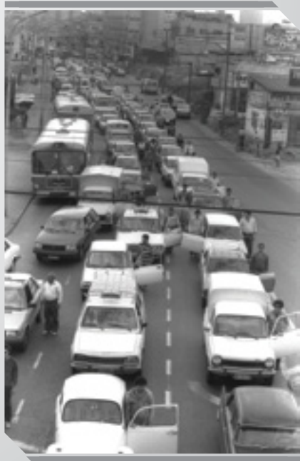
עמידה בצפייה בבוקר של יום הזיכרון לחללי צה"ל, 28/4/2009, צלם: יעקוב סער, לע"מ.