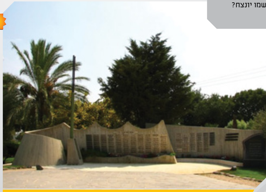
אתר הנצחה ללוחם הבדואי תמונה זו הינה חלק ממפעל ההנצחה יזכור שנערך על ידי משרד הביטחון