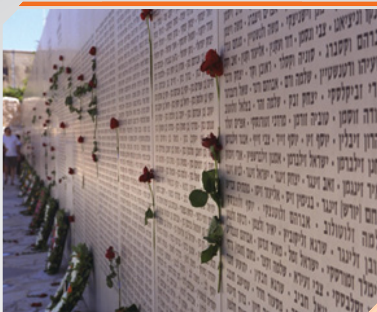
ורדים מודבקים על קיר הנצחה לחללי צה"ל, לטרון, 26/4/2001, צלם: אבי אחיון, לע"מ.