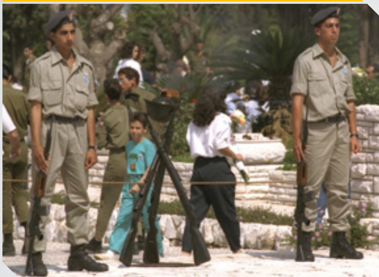
שני חיילים עומדים ביום הזיכרון במשמר הכבוד בבית קברות הצבאי בקרית שאול, 9/5/1981, צלם: צביקה ישראל, לע"מ.

על פי החוק במדינת ישראל, ד' באייר נקבע כ"יום זיכרון-גבורה ללוחמי מערכות ישראל, שנפלו למען תקומת ישראל, ללוחמי צבא-ההגנה לישראל, שמסרו נפשם על הבטחת קיומה של מדינת ישראל, ולנפגעי פעולות האיבה". היום מוקדש להתייחדות עם זכרם ודמותם של הנופלים, ולהעלאת מעשי גבורתם בעצרות ומסגרות ציבוריות שונות.