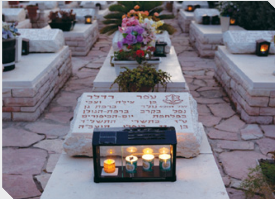
נרות זיכרון על מצבת חייל שנפל במלחמת יום הכיפורים

ליהודים יש שישה חושים: מישוש, טעם, ראייה, ריח, שמיעה [...] וזיכרון [...] עבור היהודים, הזיכרון הוא לא פחות בסיסי מדקירת מחט, או נצנוצה הכסוף, או טעם הדם שהיא שולפת מן האצבע. היהודי נדקר על ידי סיכה ונזכר בסיכות אחרות. רק בכך שדקירת הסיכה מחזירה אותו אחורה אל דקירות סיכה קודמות - כשאמו ניסתה לתקן את שרוול חולצתו כשזרועו עוד הייתה בפנים, כשאצבעותיו של סבו נרדמו מרוב שליטפו את מצחה הלח של אם-סבו, כשאברהם בחן את חוד הסכין כדי להיות בטוח שיצחק לא יחוש כאב - היהודי יכול להבין למה זה כואב. כשיהודי נתקל בסיכה, הוא שואל: כמו מה זה נזכר?