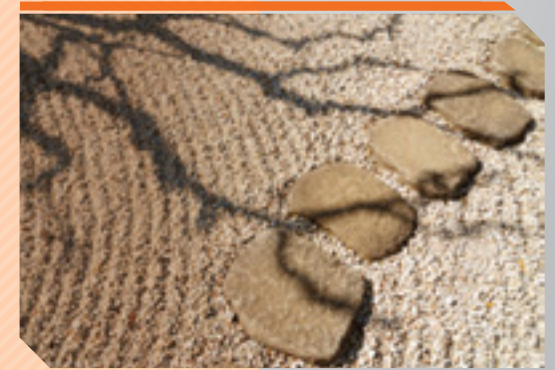
זיכרון כסימני דרך תמונה זו הינה חלק ממפעל ההנצחה זיכור שנערך על ידי משרד הביטחון

נזכור אחים ורעים אשר יחד יצאו עמנו בפלוגות הלוחמים אנחנו חזרנו והמה לא ישוכו עוד גלים-גלים עלו, שטפו וחזרו המה נותרו על החוף אין שוב צעירים יצאו וחסונים, נאים ותמירים כצמח השדה, עד שהשיגתם העופרת ורסיסי המוות קטלום.