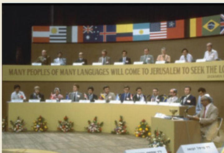
חידון התנ"ך הבינלאומי, תיאטרון ירושלים 1981, צלם: הרמן חנניה, לע"מ

דוד בן-גוריון היה מעריץ נלהב של התנ"ך בפרשנות הפשט, ואימץ את התנ"ך כבסיס היסטורי, משפטי ומוסרי של שיבת עם ישראל לארצו. התנ"ך היה חלק מתפיסתו הממלכתית של בן-גוריון, שהפך את התנ"ך "לאבן התשתית של השקפת עולמו" תוך שלילת היהדות הגלונית על כל גילוייה. עם ישראל בתקופת המקרא היה בעיניו דגם ומופת לריבונותו של עם ישראל בארצו, ואילו הגלות - ביטוי לפסיביות של העם, לתלותו בזרים ולהיעדר כושר היצירה. בן-גוריון ראה בתנ"ך את "יצירתו הגדולה והנעלה ביותר של העם היהודי מבחינה לאומית, היסטורית, דתית ותרבותית, וכן מבחינת המוסר הכלל עולמי". וכל יהודי, מאמין או כופר בעיקר, אמור למצוא בתנ"ך "את מקורותיו, שורשיו ההיסטוריים והמוסריים".