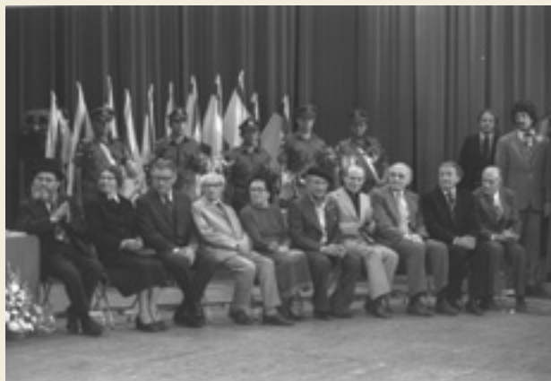
טקס פרס ישראל, תאטרון ירושלים 1.5.78, צלם: משה מילנר, לע"מ