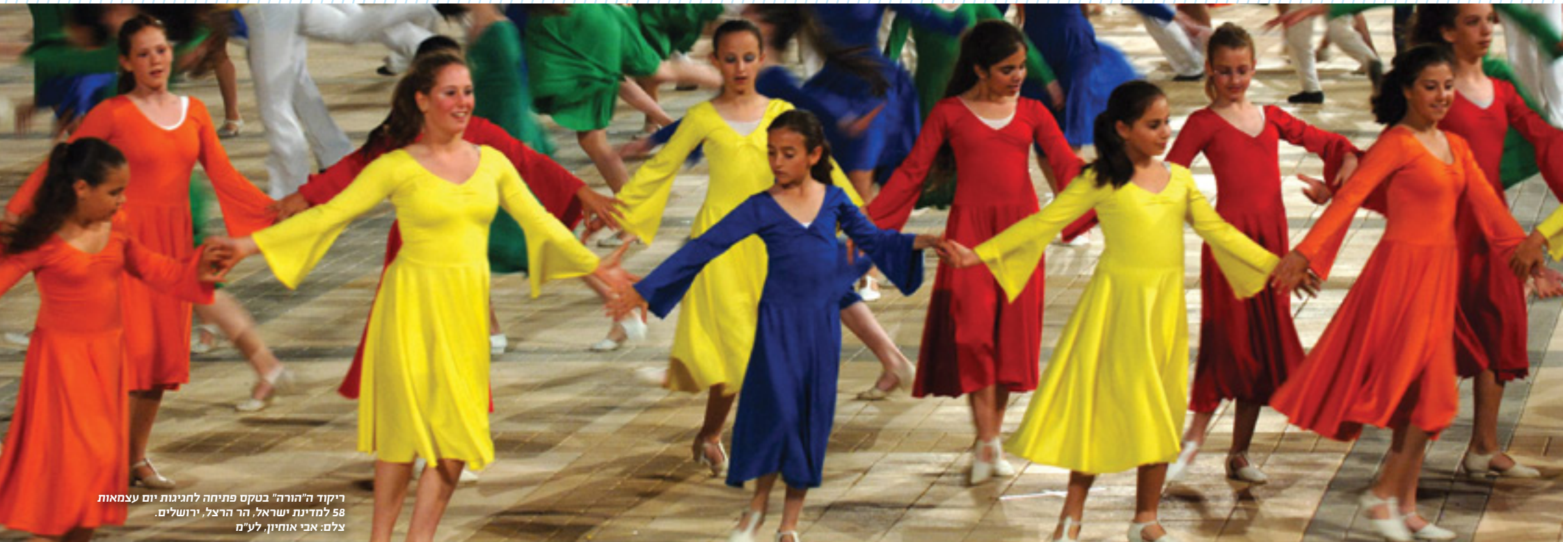
ריקוד ה"הורה" בטקס פתיחה לחגיגות יום עצמאות 58 למדינת ישראל, הר הרצל, ירושלים.

כתיבה ועיבוד: רותי זוסמן הפקה: לוראנס רוזנרט ייעוץ פדגוגי: ציפי קוריזקי, שרה שי הוצאה לאור: משרד החינוך - גף פרסומים