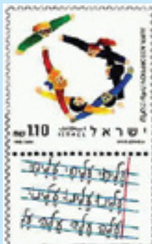
קליטת עלייה 4.9.90

מהי משמעות המגן דוד בתמונת הבול? אילו ערכים חרתה מדינת ישראל על דגלה ע"פ בול זה?