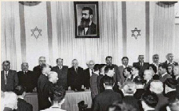
תפילת "שהחיינו" ושירת התקווה בסיום טקס ההכרזה

אילו מאפיינים של הטקס נשמרו על אף החיפזון והאלתור? (היעזרו בתמונות ובטקסט לאיתור המידע). איזו תחושה מעוררת הידיעה שהטקס שבו "נוסדה" מדינת ישראל היה כה צנוע וקצר? אילו תכונות ועמדות משקף הטקס (חשבו הן על המארגנים והן על הקהל)? האם חל שינוי משמעותי מאז? מה דעתכם על כך?