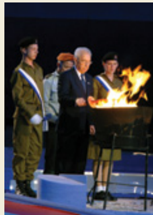
טקס הדלקת המשואות בהר הרצל שנת השישים למדינת ישראל 30.4.06

"טקסים משמשים אותנו על מנת להגדיר מי אנחנו ומה מערכת הגומלין הקיימת בינינו לבין אחרים, ובינינו לבין העולם כולו". - האם טענה זו נכונה לגבי טקסים הנהוגים בראש השנה, פסח, יום העצמאות? מדוע?