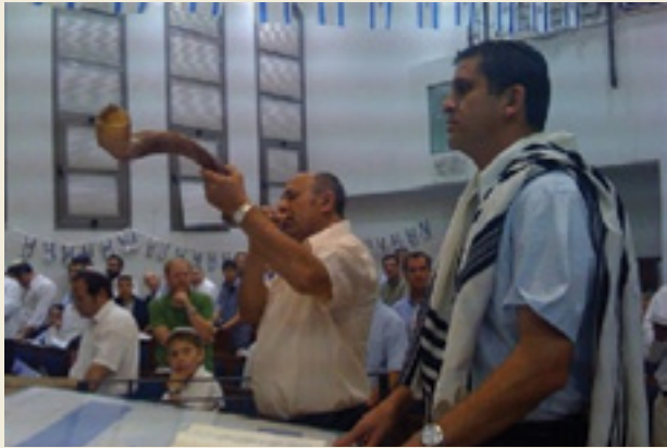
"תקע בשופר גדול לחרותנו..." יום העצמאות בבית הכנסת, אתר דתילי צלם: ד"ר מוטי גולן

מה חשוב בימינו: לשמר מנהגים ציבוריים ביום העצמאות או לטפח מסורות אישיות ומשפחתיות? מדוע?