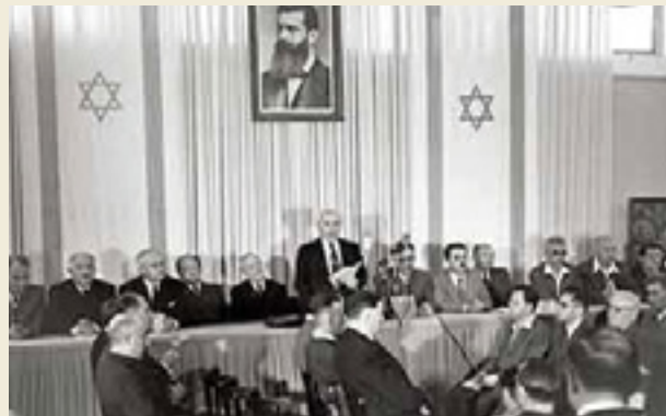
דוד בן גוריון קורא את מגילת העצמאות במוזיאון, תל אביב.

אתם ה"דורות הבאים" שאליהם בן-גוריון מתייחס בדבריו. האם המשימה שבן-גוריון מגדיר בדבריו כבוצעה? מהו התפקיד שלכם בהשלמת משימה זו? מדוע הייתה התלבטות לגבי ההכרזה על הקמת המדינה? שערו מדוע החליט בן-גוריון להכריז על הקמתה למרות הכול?