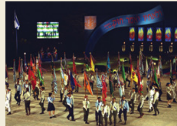
טקס יום העצמאות הר הרצל 23.4.01