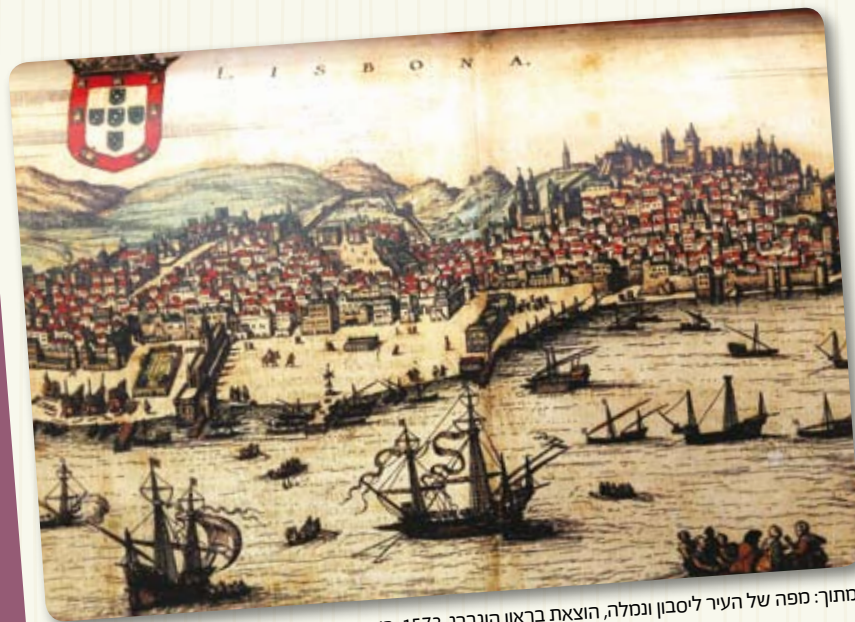
מתוך: מפה של העיר ליסבון וגמלה, הוצאת בראון הוגברג, 1572, בית הספרים הלאומי האוניברסיטה העברית