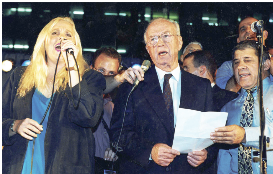
ראש הממשלה יצחק רבין והזמרת מירי אלוני בעצרת ההמונים "כן לשלום - לא לאלילות" 4 בנובמבר 1995, י"ב בחשוון תשנ"ו

לפי ההגדרה הזאת, אין הבדל בפעולה בין רצח פוליטי ובין כל רצח אחר שנעשה בכוונה תחילה. מהו, אם כן, ההבדל? ההבדל הוא במניע - מצד אחד, ו בהשפעה - מן הצד האחר. מי שמבצע רצח פוליטי עושה זאת כדי להשפיע על המציאות ולעצב אותה מחדש, ולרוב רצח כזה מכאן למנהיגים מובילים, לקובעי מדיניות ולבעלי השפעה. נחזור לאחת הרציחות הפוליטיות הראשונות המוכרות לנו במקורות היהודיים.