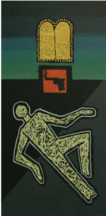
זן קדר, מתוך על פני תהום - מיצב . המיצב נוצר בעקבות רצח רבין.