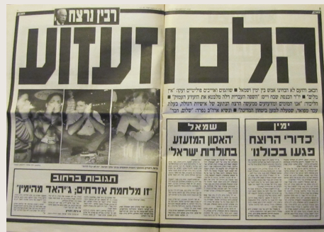
כותרות ותמונות בעיתון "מערב" יומיים לאחר הרצח, ב-6 בנובמבר 1995