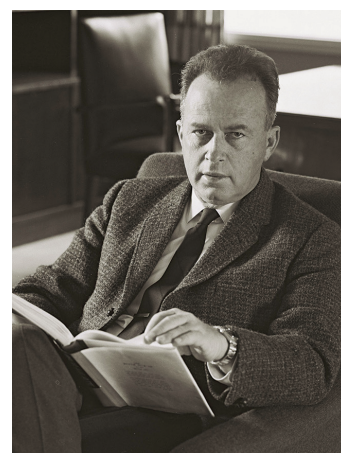
יצחק רבין, שגריר בושינגטון (1973-1968) ארצות הברית