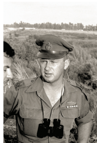
יצחק רבין, אלוף פיקוד הצפון (1956-1959)

ואכן, לאחר שעמד בראש צבא לוחם, קידם רבין את הסכמי השלום. פעמים רבות הוא ציין את העובדה שקשה לו לדבר עם אויבים, אך בעיניו זוהי הדרך היחידה האפשרית.