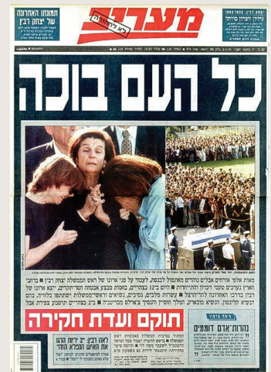
כותרות ותמונות בעיתון "מערב" יום לאחר הרצח, ב-5 בנובמבר 1995

הרצח גרם, כפי שכבר ציינו, זעזוע עמוק בכל חלקי העם, ובהמשך הביא גם להקדמת מערכת הבחירות, לחילופי השלטון ולשינוי המדיניות. לרצח הייתה, אם כן, השפעה דרמטית על מדינת ישראל, והוא שינה את דרכה המדינית. הרצח, יגאל עמיר, נשפט ונדון על מעשהו למאסר עולם.