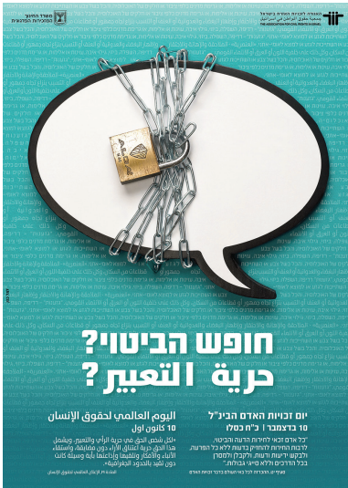
(עיצוב: יוסי למל, עבור האגודה לזכויות האזרח)

אחת הסכנות הגדולות האורבות לדמוקרטיה היא הניסיון להגיע להכרעה באמצעות אלימות ולא באמצעים דמוקרטיים. ואכן, העצרת שבה נרצח יצחק רבין נקראה - "לא לאלימות, כן לשלום".