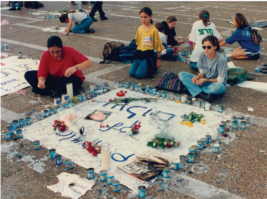
בני נוער אבלים על יצחק רבין בכיכר מלכי ישראל, שמאחר יותר שונה שמה לכיכר רבין

בהלווייתו של רבין השתתפו כ-80 ראשי מדינות וראשי ממשלות מהעולם כולו, לצד אלפי אזרחים שחלקו לו כבוד אחרון. במהלך כל השבוע שלאחר הרצח, אזרחים רבים פקדו את הכיכר שבה הוא נרצח. הם הדליקו נרות, שרו בצוואתא וכאבו את לכתו, את הדרך שבה אירע הדבר ואת אובדן התקווה לשלום. בעקבות הרצח הוסב שמה של הכיכר ל"כיכר רבין", כפי שאתם ודאי מכירים אותה כיום.