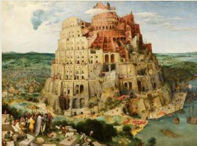
פיטר ברויגל, מגדל בבל, 1563

אספרנטו: שְׁמָה של השפה בא משם העט של זמנהוף, שבו חתם על ספרו הראשון - דוקטורו אֶסְפֶּרַנְטוֹ, ובעברית: "הדוקטור המקנה" ... שנים רבות לאחר שהמציא את השפה, סיפר זמנהוף שהיו לו שתי מטרות לעשות את זה: הראשונה מעשית, והשנייה אידיאליסטית. המטרה המעשית הייתה להקל על התקשורת בין אנשים דוברי שפות שונות לצרכים כמו מדע, מסחר ופוליטיקה. המטרה האחרת הייתה חשובה לא פחות: זמנהוף ראה בכל בני האדם בניים למשפחה אחת גדולה, היא משפחת האנושות, והאמין שצריך לחַזֵק את תחושת השייכות הזו. בעיניו, מלחמות קורות משום שאומות מסוימות רוצות לכפות את התרבות שלהן על עמים אחרים, וביום שכולם ידברו בשפה אחת אנשים יהיו פחות חֲשָׁדָנִים ולא ינסו לכפות זה על זה את תרבותם.