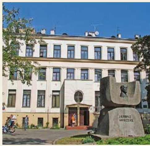
בית היתומים "היהודי" של יאנוש קורצ'אק ברח' קרוכמלנה

א' בוכנר על יאנוש קורצ'אק, בתוך: 'קורצ'אק, בני האדם הם טובים, ת"א תשל"ג, עמ' 11