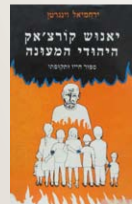
כריכת הספר "יאנוש קורצ'אק: היהודי המעונה", מאת ירחמיאל ינגרטן, הוצאת יד ושם.