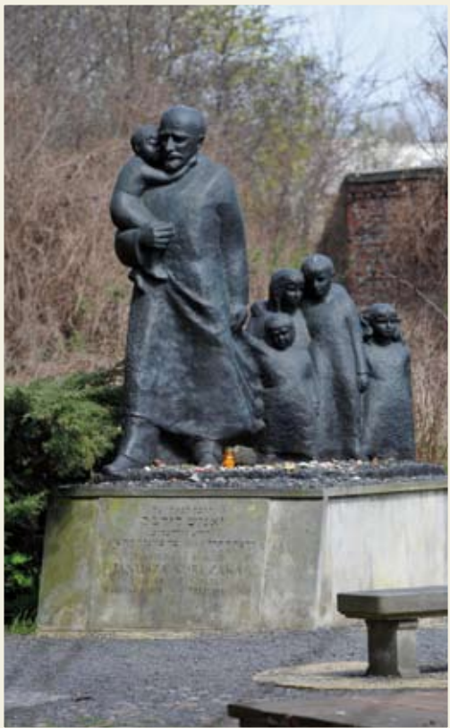
אנדרטה להנריק גולדשמיט (יאנוש קורצ'אק). כניסה לבית הקברות היהודי בוורשה

מתוך: 'אנוש קורצ'אק - בין העולמות', עיונים במורשתו של יאנוש קורצ'אק, הוצאת בית לחמי הגטאות ואוניברסיטת חיפה, 1996