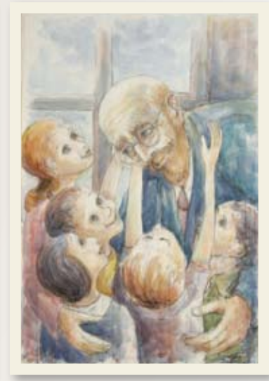
יצחק בלפר, שיחה עם הילדים