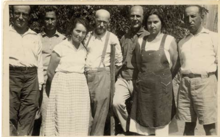
קורצ'אק בביקורו בקיבוץ עין חרוד

"לא את הכול אני יודע עדיין, אבל הסוף יהיה כזה, שהיהודים, תהיה להם מדינה שלהם בארץ ישראל" (יאנוש קורצ'אק, כך אני מהרהר, דבר לילדים, 1939). יאנוש קורצ'אק הגיע לשני ביקורים בארץ ישראל. את הביקור הראשון עשה בקיבוץ עין חרוד למשך שלושה שבועות, ואת ביקורו השני בשנת 1936 עשה במקומות שונים בארץ מתוך כוונה להשתקע בה.