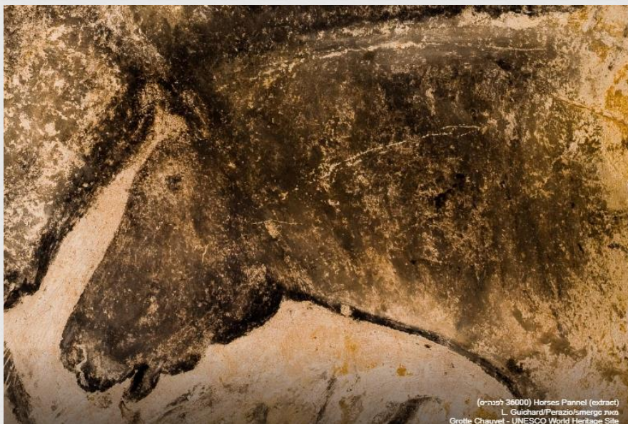
(36000 לפנינו) Horses Panel (extract) ג'ורדן / פריז / צרפת Grotte Chauvet - UNESCO World Heritage Site