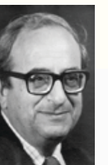
יצחק נבון נשיא בין השנים 1978 - 1983

המצב הביטחוני הרעוע באזור נתן אותותיו גם בחברי הקבוצה. כמה מהם נהרגו בעימותים עם הברואים תושבי האזור ובמארבי ירי לכבישים. עקב כך הגיעה למקום מחלקה מהנח"ל, שמנתה כ-60 חיילים, אשר הגדילו באופן משמעותי את מספר החברים. בשנת 1954 הגיעה לחווה מחלקה נוספת של הנח"ל. לאחר תום שירות החיילים, חיפשו חברי הקבוצה בני גרעין מתנועה לא מפלגתית אשר יסכימו להישאר במקום גם לאחר שירותם הצבאי. בהמשך הגיע למקום גרעין של תנועת "הצופים" אשר הביא לפיתוח ענפים חדשים במשק: הקמת מוסך, מסגרייה, נגרייה ונטיעת מטע אפרסקים. באוקטובר 1955 החליטו חברי הקבוצה כי שדה בוקר יהיה קיבוץ לא רק באורח חייו אלא גם באופן רשמי.