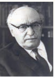
זלמן שזר נשיא בין השנים 1963 - 1973

“עילוב בין כל חלקי האומה במדינה, על כל עדותיה ועבטיה... ועילוב דורנו בתוך עלמלת הזרות על האומה