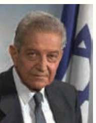
עזר ויצמן נשיא בין השנים 1993 - 2000

לא דק לזכור את העבר ולקדוא את ההווה, אלא גם ליצור את העתיד.