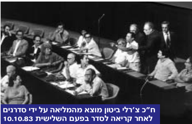
ח"כ צ'רלי ביטון מוצא מהמליאה על ידי סדרנים לאחר קריאה לסדר בפעם השלישית 10.10.83

על-פי חוק-יסוד: הממשלה (ר' חוק-יסוד), "הממשלה מכהנת מכוח אמון הכנסת". בהתאם לשיטה של הבחירה הישירה של ראש הממשלה, יכול היה גם ראש הממשלה להכריז שהוא רואה בהצבעה מסוימת הבעת אמון בו. עם כניסתה לתוקף של הגרסה החדשה של חוק-יסוד: הממשלה, המבטלת את הבחירה הישירה, תוכל הממשלה להכריז שהיא רואה בהצבעה מסוימת הבעת אמון בה.