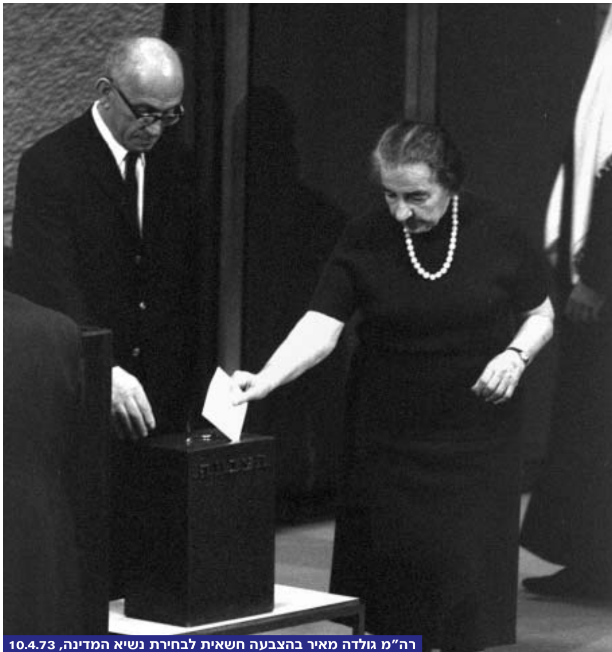
רה"מ גולדה מאיר בהצבעה חשאית לבחירת נשיא המדינה, 10.4.73