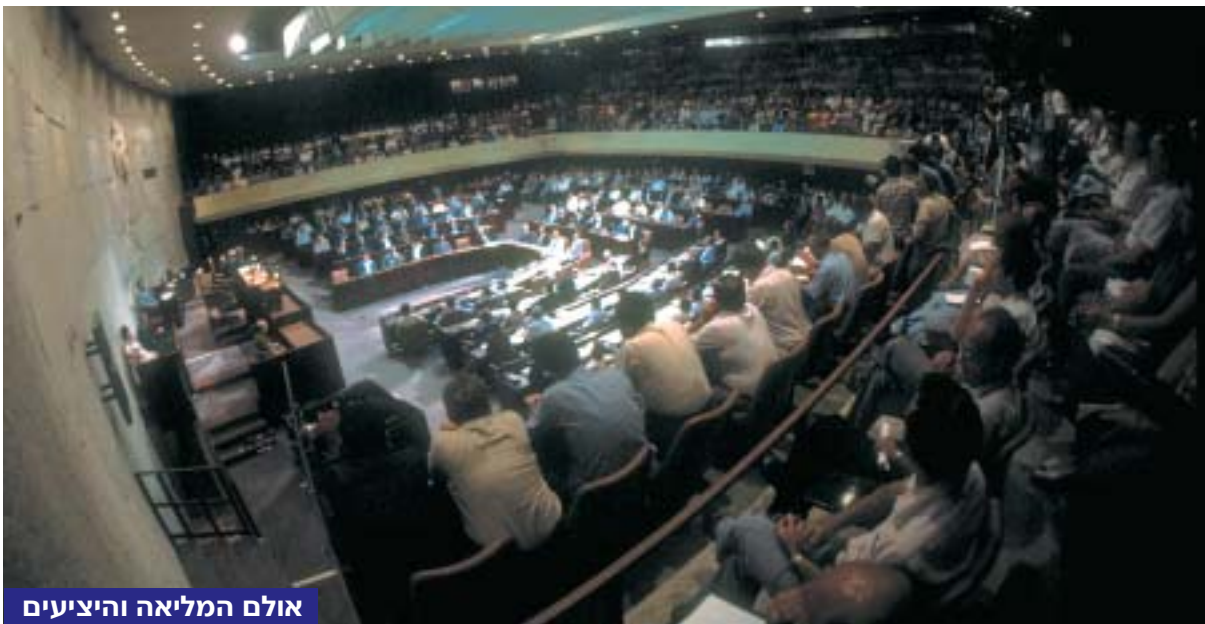
אולם המליאה והיציעים