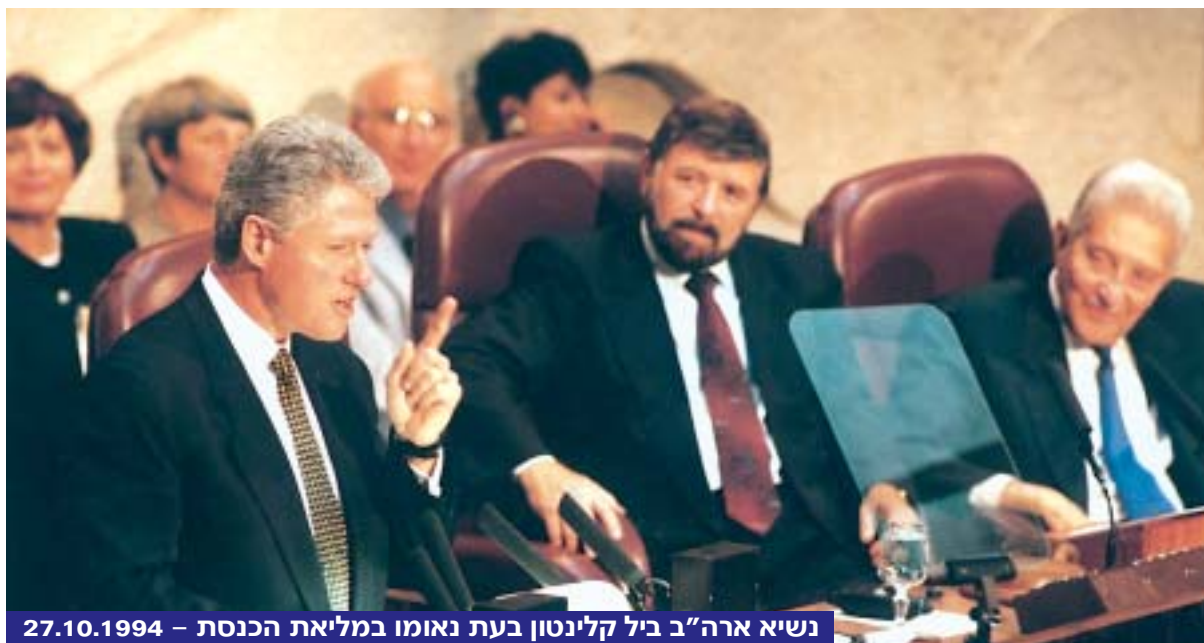
נשיא ארה"ב ביל קלינטון בעת נאומו במליאת הכנסת – 27.10.1994

מליאת הכנסת מתכנסת מידי שבוע, בימים ב', ג' מהשעה 16:00 וביום ד' מהשעה 11:00, פרט לתקופת הפגרה. הישיבה נמשכת, בדרך כלל, כארבע שעות, אם כי ייתכנו ישיבות קצרות יותר או ארוכות יותר. סדר היום השבועי של הכנסת נקבע מראש על ידי נשיאות הכנסת, כלומר על ידי יו"ר הכנסת וסגניו, כאשר ישיבה אחת בשבוע מוקדשת לדיון בהצעות לסדר היום ובהצעות חוק פרטיות, ושתי ישיבות נוספות מיועדות למתן תשובות על שאילתות.