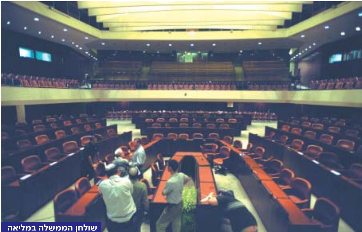
שולחן הממשלה במליאה

מקום מושבם של השרים באולם המליאה הוא סביב שולחן הממשלה. השולחן, דמוי פרסה, עומד במרכז האולם, מול בימת יושב-הראש. סביב השולחן יושבים גם שרים שאינם חברי כנסת. לקראת כינונה של הממשלה ה-29, הגדולה במיוחד, נוסף שולחן, אף הוא דמוי פרסה, במרכז השולחן הישן.