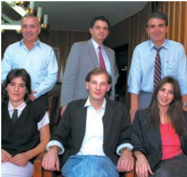
חברי הכנסת מיכאל בר-זוהר, עמנואל זיסמן וגדעון גדות עם העוזרים הפרלמנטריים שלהם 7.11.89

ערוץ הכנסת הוא ערוץ טלוויזיה המשדר מן הכנסת בהתאם לחוק שידורי טלוויזיה מהכנסת, התשס"ד-2003. מטרתו של הערוץ היא לאפשר נגישות לדיוני הכנסת ולעבודתה, לטפח מודעות אזרחית ולחזק את ערכי הדמוקרטיה. הערוץ מעביר בשידור חי את ישיבות מליאת הכנסת במלואן, את דיוני ועדות נבחרות וארועים ממלכתיים שונים. כמו כן מגיש הערוץ מהדורה מסכמת של חדשות היום, תכנית נוער, תכנית בוקר אקטואלית ותכניות המבוססות על ראיונות עם חברי כנסת.