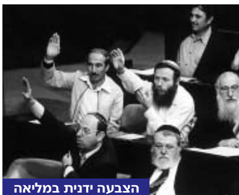
הצבעה ידנית במליאה