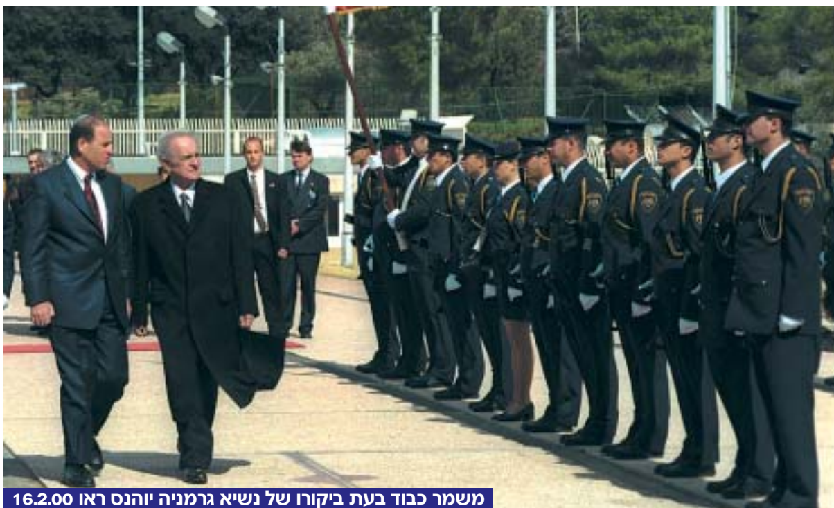
משמר כבוד בעת ביקורו של נשיא גרמניה יוהנס ראו 16.2.00

בנושאים בעלי משמעות עקרונית או חשיבות פוליטית ואידיאולוגית, נוהגות הסיעות להטיל משמעת סיעתית בהצבעות במליאת הכנסת ובוועדות הכנסת – כלומר, חברי הסיעה חייבים להצביע לפי החלטת הסיעה. בשנים האחרונות, בייחוד מאז הנהגת בחירות מקדימות (פריימריס) במפלגות רבות, התרופפה עד מאוד המשמעת הסיעתית.