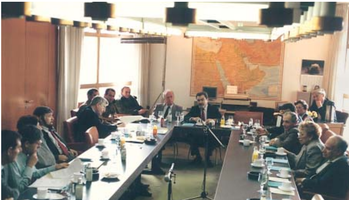
ישיבת ועדת החוץ והביטחון בראשותו של ח"כ אליהו בן-אלישר ובהשתתפות שר הביטחון יצחק רבין, 23.3.89

ועדת העלייה, הקליטה והתפוצות , שתחומי עיסוקה: עלייה; קליטה; הטיפול ביורדים; חינוך יהודי וציוני בגולה; מכלול הנושאים הקשורים בעניינים אלה והנמצאים בתחום טיפולו של המוסד לתיאום בין ממשלת ישראל לבין ההסתדרות הציונית העולמית ובין ממשלת ישראל לבין הסוכנות היהודית.