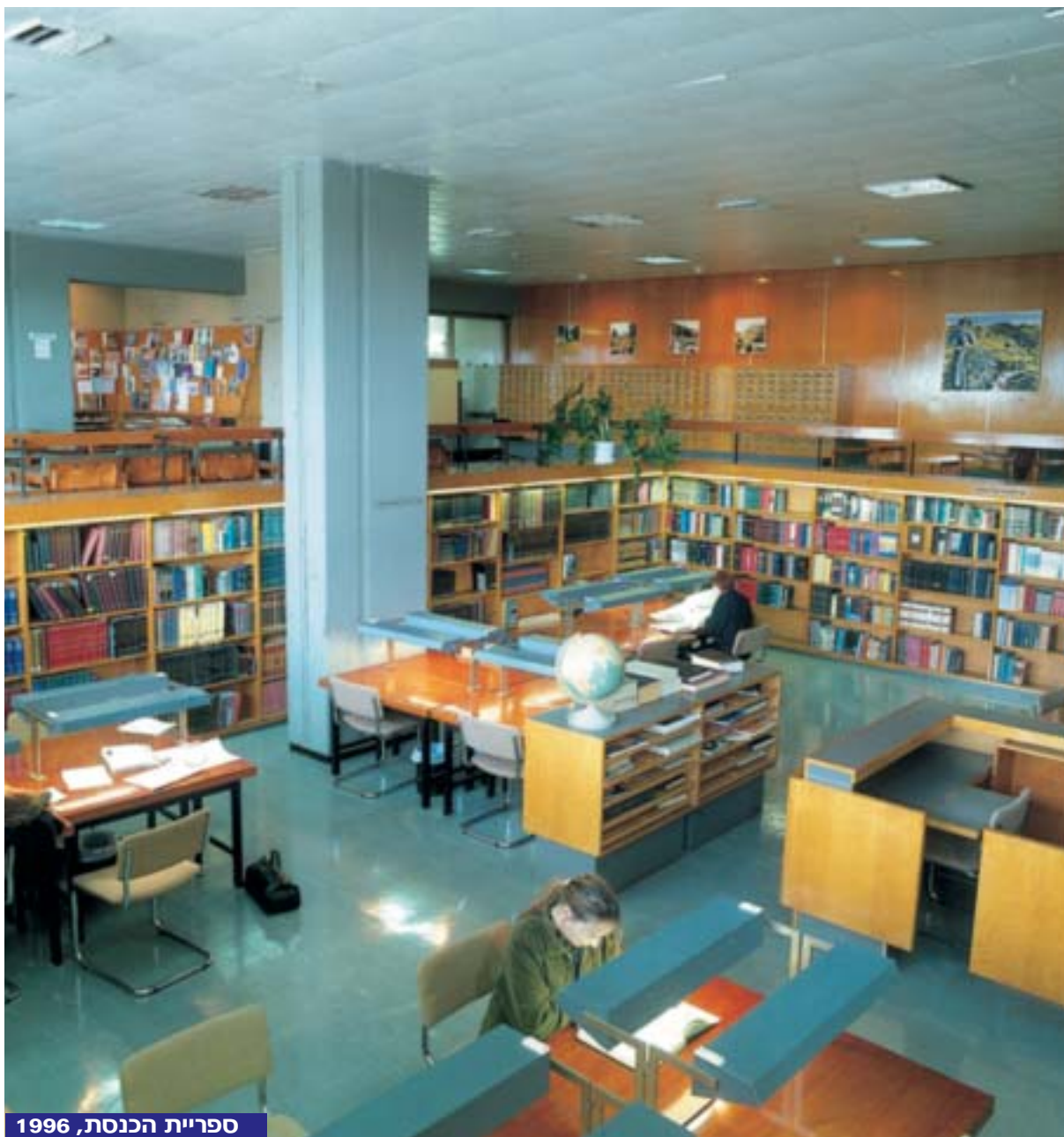
ספריית הכנסת, 1996