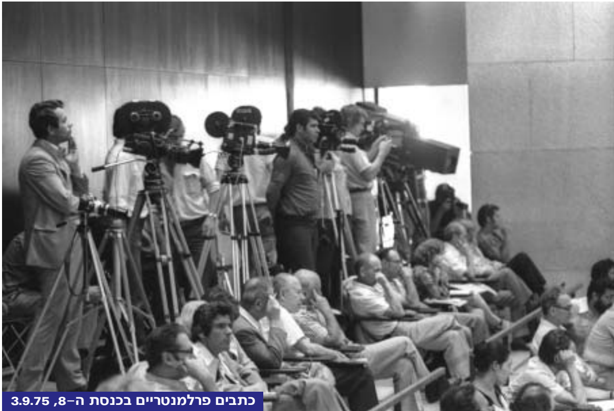
כתבים פרלמנטריים בכנסת ה-8, 3.9.75

מליאת הכנסת מקיימת את ישיבותיה הקבועות, כשאין הכנסת נמצאת בפגרה, בימים שני, שלישי ורביעי. מספר הישיבות השבועיות ומועדיהן נקבעים על-ידי יושב-ראש הכנסת באישור ועדת הכנסת (ר' ועדות קבועות). סדר היום של ישיבות הכנסת נקבע על-ידי יושב-ראש הכנסת וסגניו (נשיאות הכנסת). ישיבות הכנסת פומביות, למרות שלכנסת הזכות להחליט לשבת בדלתיים סגורות – דבר שמעולם לא קרה. פרטוקולים של הישיבות מפורסמים ב"דברי הכנסת".