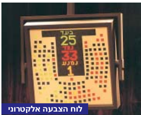
לוח הצבעה אלקטרוני

חבר כנסת המשתתף בהצבעה יכול להצביע בעד או נגד, או להימנע. ישנם כמה סוגים של הצבעות במליאה: הצבעה בהרמת יד, שבה נמנים המצביעים בעד ונגד והנמנעים על-ידי מונים מבין חברי הכנסת; הצבעה אלקטרונית מתקיימת באמצעות לחיצה על לחצנים המותקנים במקום מושבם של חברי הכנסת. לכל חבר כנסת ארבעה לחצנים, אחד להצבעה בעד, אחד להצבעה נגד, אחד להימנעות והרביעי לזיהוי. תוצאות ההצבעה נראות על לוחות ההצבעה