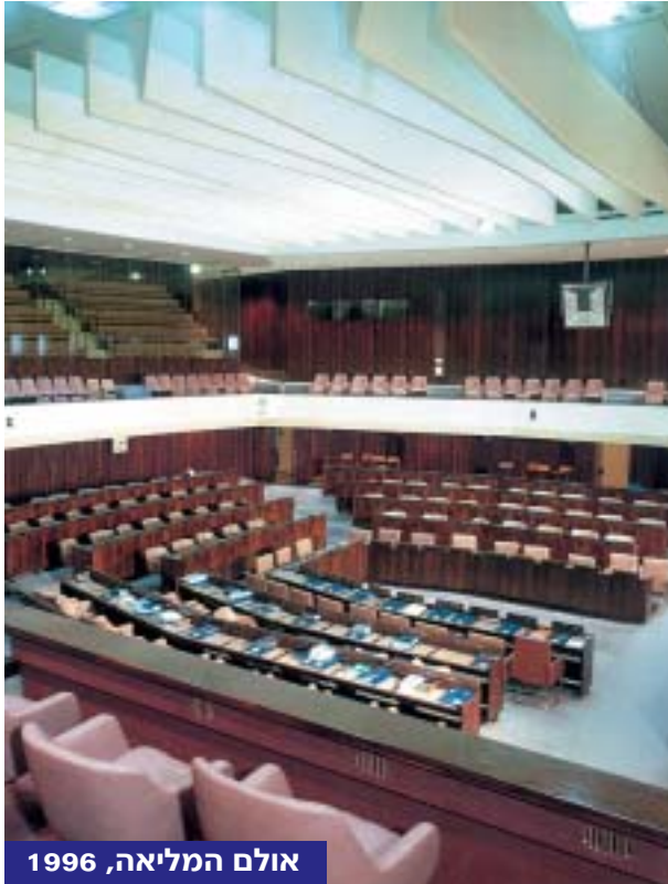
אולם המליאה, 1996