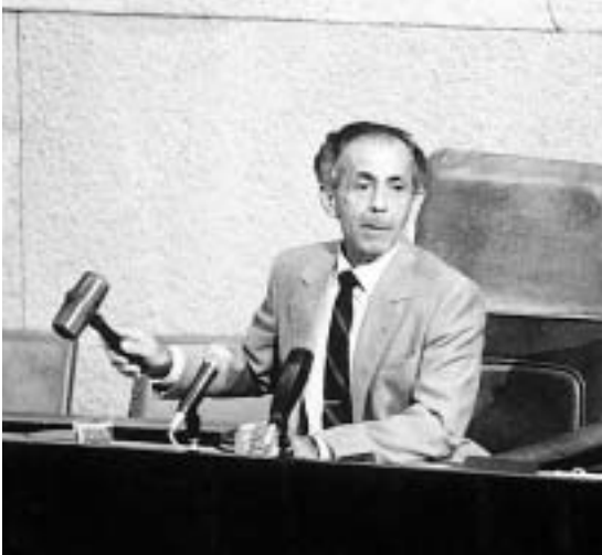
יושב ראש הכנסת ה-11, ח"כ שלמה הלל

יושב-ראש הכנסת הוא העומד בראש הכנסת ומנהל את ענייניה. הוא נבחר על-ידי הכנסת מבין חבריה, בדרך כלל בישיבה הראשונה של כנסת חדשה, בהצבעה גלויה. הוא נבחר לכל תקופת כהונתה של הכנסת ויכול להיבחר יותר מפעם אחת. יושב-ראש הכנסת מייצג את הכנסת כלפי חוץ ואחראי על שמירת כבודה, על סדר ישיבותיה, על קיום תקנונה (ר' תקנון הכנסת) ועל קביעת סדר היום של ישיבותיה (יחד עם סגניו). יושב-ראש הכנסת, או אחד מסגניו, יושבים בראש ומנהלים את ישיבות מליאת הכנסת. בנוסף, הוא מופקד על שמירת חסינותם של חברי הכנסת ומשכן הכנסת ורחבתה (ר' חסינות), ואחראי על מזכיר הכנסת, על מזכירות הכנסת ועל תקציב הכנסת, כמו גם על קצין הכנסת ועל עובדי הכנסת. יושב-ראש הכנסת ממלא את מקומו של נשיא המדינה בהעדרו. כנשיא בפועל יושב-ראש הכנסת הוא השלישי במעלה בין אישי המדינה, לאחר נשיא המדינה וראש הממשלה.