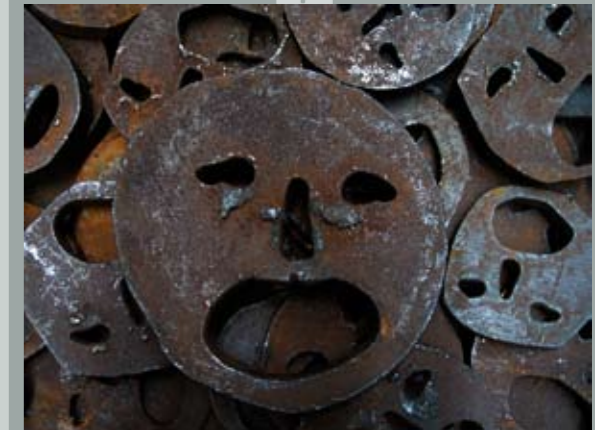
מנשה קדישמן, שלכת

שם: יום הזיכרון לשואה ולגבורה מועד: כ"ז בניסן (כשבוע לפני יום הזיכרון לחללי צה"ל ויום העצמאות) הורים: היום נקבע על ידי הכנסת ב"חוק יום הזיכרון לשואה ולגבורה", תשי"ט - 1959 מנהגים: עצרת ממלכתית ביד ושם בירושלים בערב יום השואה; צפירת דומיה בת שתי דקות ולאחריה אירועי זיכרון ליד אנדרטאות, בתי ספר, מחנות צה"ל ומוסדות ציבור; מעמד קריאת שמות הנספים כמשכן הכנסת וב"אוהל יזכור" ביד ושם; הורדת דגלי ישראל לחצי התורן; סגירת מרכזי בילויים; משלחות נוער וצה"ל לפולין. משמעותיות: זיכרון אישי ולאומי; גילויי גבורה; קדושת החיים; קידוש השם; שואה ותקומה.