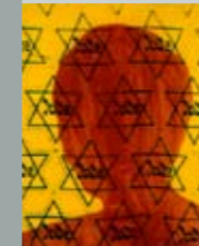
ליבנו וישל יהודית, צללית