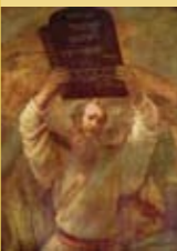
"משה והלוחות", ציור מאת רמברנדט, 1659