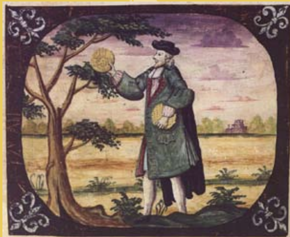
פיליפ אייזיק לוי מוחרן הגדת קופנהגן 1739

שם חג המצות, חג האביב, חג הפסח, זמן חירותנו; הראשון מבין שלוש הרגלים. הורים מייסדים נחוג בראשונה על ידי אבותינו שיצאו ממצרים לפני כשלוש אלפים וחמש מאות שנה (למשל, שמות יב). מועד ט"ו בניסן, שהוא "ראשון לחודשי השנה" על פי מניין התורה. עונה אביב: "שמור את חודש האביב ועשית פסח אביב: "דברים ט"ז 1) מצוות ומנהגים איסור אכילת והחזקת חמץ; עריכת ליל הסדר: סיפור יציאת מצרים, אכילת מצה, שתיית ארבע כוסות, קערת הסדר, אפיקומן; הכנות לפסח הכוללות בין היתר: "קמחא דפסחא" (צדקה), בדיקת חמץ, ביעורו ומכירתו, הגעלת כלים; ספירת העומר (מפסח עד שבועות). זיכרון יציאת מצרים: יציאה מעבדות לחירות, גאולה לאומית; "והגדת לבנך"; משפחה; משמעות חקלאית: התחלת קציר התבואה הראשון, אביב ופריחה;