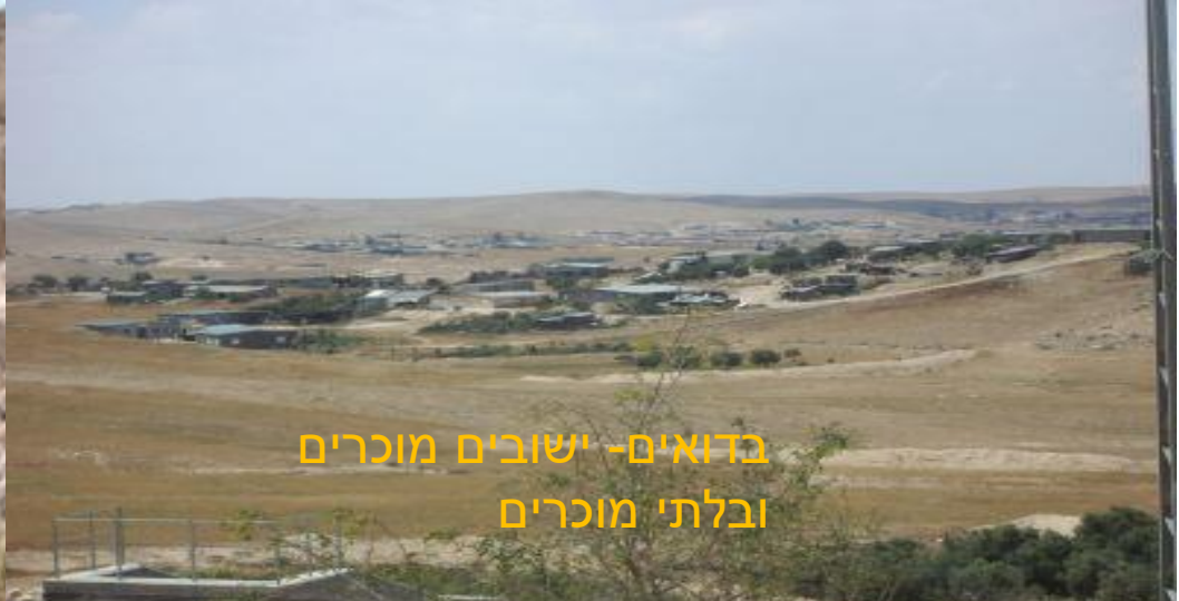
בדואים- ישובים מוכרים ובלתי מוכרים