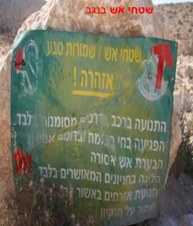
שטחי אש בנגב