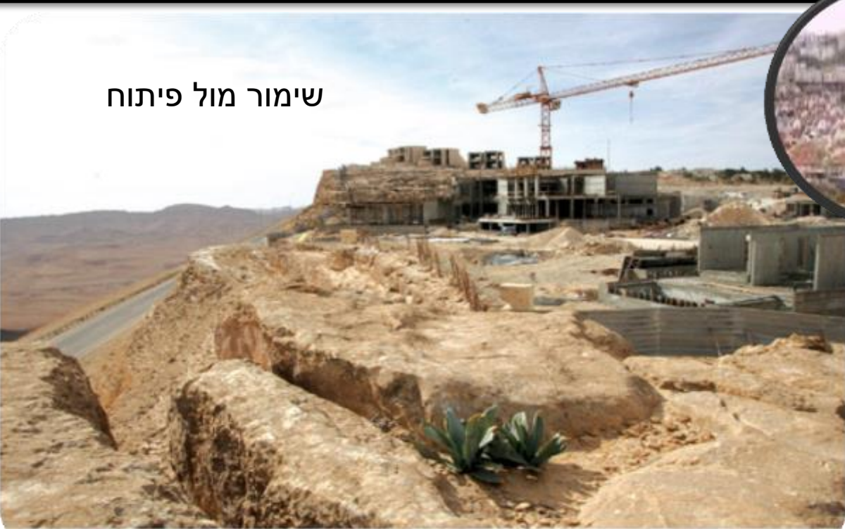
שימור מול פיתוח