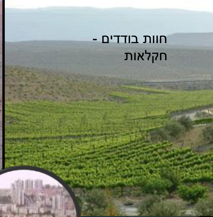
חוות בודדים - חקלאות