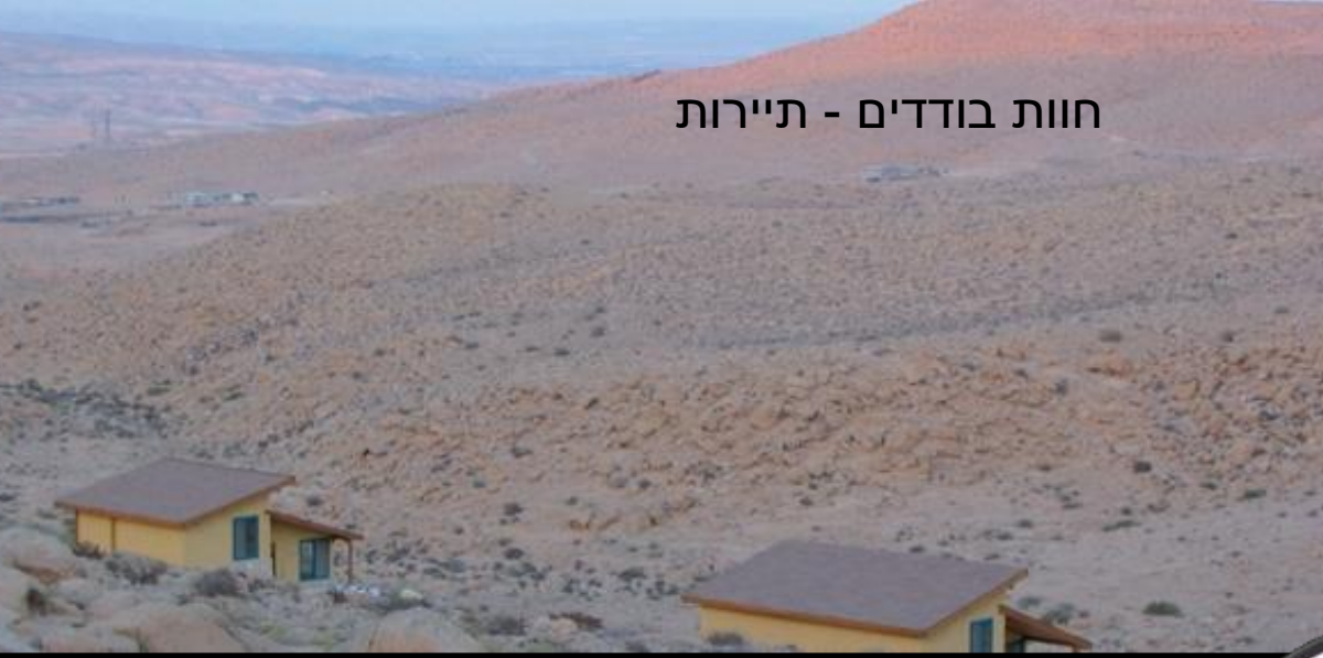
חוות בודדים - תיירות