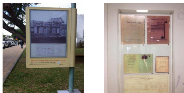
תעודות שונות מחייו של ספיר

במקום גם מסמכים שונים מחייו, תעודות ומשחק מולטימדיה הנותנים הצצה לתורתו הכלכלית של ספיר שהובילה לפריחת המשק הכלכלי במדינה.