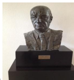
פסל של ספיר מתצוגת המוזיאון

במוזאון עצמו קיימת תערוכה מקיפה אודות חייו של פנחס ספיר שעל שמו נקראת קריית המוזאון. ספיר היה שר האוצר השלישי של מדינת ישראל, שר המסחר והתעשייה, חבר בכנסת הרביעית עד השמינית, מזכיר מפלגת העבודה ויושב ראש ההנהלה הציונית. עם עלייתו לארץ בשנת 1930 התיישב בכפר סבא ובה התגורר עד למותו.