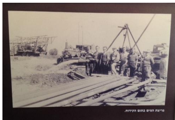
פריצת המים בתום הקידוח.

הבאר הראשונה עד 1906 נאלצו המתיישבים להביא את את מיםיהם מ"עין ח'י" (כיום כפר סבא). עם בניית הבניין התיכורי ה"חאן" באותה שנה, נחפרה הבאר הראשונה, בעומק של מטר. הבאר נבנתה ממלוקים כבדים ומעוגלים בעובי 35 ס"מ.