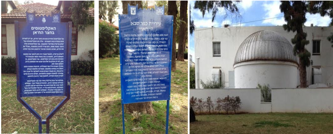
בניין החאן כיום ושלטי המידע על החאן ועל האקליפטוסים שניטעו בתחמו.

כיום ניתן לראות במתחם תמונות המלמדות על הקמת בריכת המים וחפירת באר המים הראשונה במושבה ואף לצפות בבאר ובמגדל הקידוח: