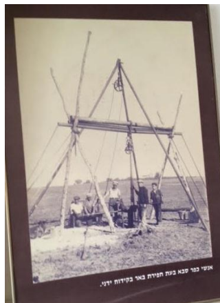
אפי כפר סבא בית חפירת באר בקידוח ודין.

כיום ניתן לראות במתחם תמונות המלמדות על הקמת בריכת המים וחפירת באר המים הראשונה במושבה ואף לצפות בבאר ובמגדל הקידוח: