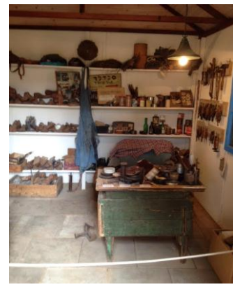
הצריף מבפנים ומבחוץ.