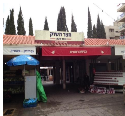
מתחם חצר השוק