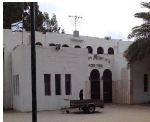
בית הכנסת הגדול