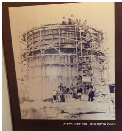
הקמת בריכת מים. כפר סבא, תרצ"ו.