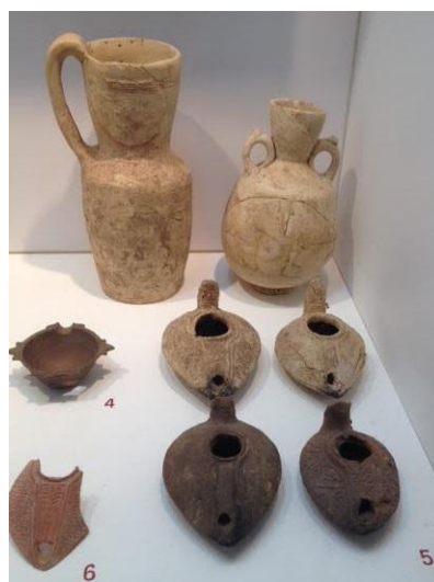
ממצאים שונים מהחפירות באזור.

בחצר המוזאון ישנם מספר פסיפסים מרהיבים ובהם רפליקה של פסיפס כתובת תל רחוב מהמאה החמישי לספירה מעמק בית שאן בה מוזכרת "כפר סבה".