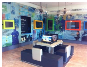
הכניסה למרכז הלימודי