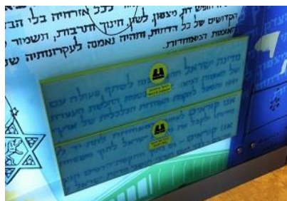
מגירות הפעלה ממוחשבות