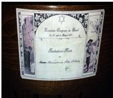
כרטיסי מקום בקונגרס

המבקרים במוזיאון נטמעים בתוך רחוב מאותה התקופה