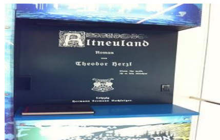
פעילות בנושא ספרו "אלטנוילנד"