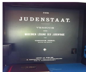
פעילות סביב ספרו של הרצל "מדינת היהודים"