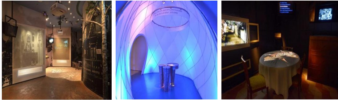
תמונות מתוך המוזיאון.

הסיור במוזיאון מתייחס בהרחבה לארבעת מוקדי התוכן הנגזרים מפועלו ומורשתו של בגין : דמוקרטיה פרלמנטרית - במוזיאון מוצגת עבודתו הפרלמנטרית הרחבה של בגין, הצעות חוק שהעלה, וחקיקה שבוצעה בזמן כהונתו כראש ממשלה. מנהיגות מונחית ערכים - המבקר במוזיאון נחשף לרעיונותיו של בגין בדבר הערכים שצריכים להיות הבסיס לתקומת מדינת ישראל: ערכי השיוויון, הדאגה לאוכלוסיות מוחלשות, שותפות. המאבק הציוני על הקמת המדינה - דרך סיפור מאבקו של בגין בשלטון המנדט הבריטי בארץ, נחשף למעשה הסיפור הגדול יותר של מאבק המחתרות הציוניות בבריטים והשאפה לסלקם מהארץ כדי להקים בה מדינה יהודית עצמאית. מדינת ישראל כמדינה יהודית – דמוקרטיה - תקופת כהונתו של בגין כראש ממשלה נחפשת כתקופה בה שלטון החוק היה נר לרגליו. הוא חיזק את בית המשפט העליון, דאג לשמור על אופיה היהודי של המדינה אך לא ויתר על יסודות המשטר הדמוקרטי בה.