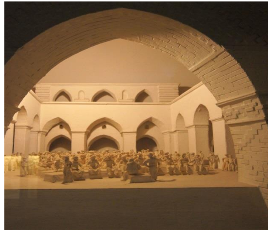
דגם של ישיבה

המרכז הרוחני בבבל: סיור זה עוסק במרכז הרוחני החשוב שקם בבבל ועלה על המרכז הרוחני בארץ ישראל. הישיבות הגדולות נהרדעא, סורא ופומבדיתא היו הסמכות הרוחנית בכל תפוצות ישראל. התלמוד הבבלי, פאר הצירה הרוחנית של עם ישראל הפך מורה הלכה לכל קהילות ישראל עד ימינו. מוסד ראשות הגולה שקם בבבל איחד את עם ישראל על כל תפוצותיו תחת הנהגת יהודי בבל ושמר על האוטונומיה היהודות במסגרת השלטון המקומי. המרכז הרוחני בבבל בתקופת התלמוד והגאונים מומחש באמצעות שחזור דגמי הישיבות ונלמד באמצעות דיון בסוגיות מהתלמוד, המחזה ודפי עבודה.