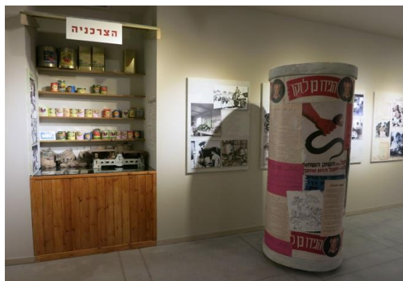
צרכניה ולוח מודעות במעברה

בפנים החלל מוצגים מעברה משוחזרת, חפצים, תצלומים ומסמכים כמו גם קריקטורות וקטעי מוזיקה, הממחישים את התקופה.