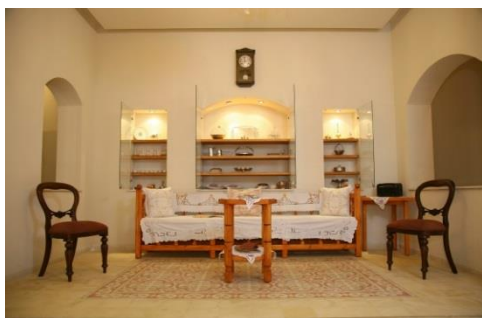
הטראר (חדר אורחים קיצי) בבית היהודי

השכונה שלי – הסמטה והבית ברובע היהודי: הסיור עובר על תצוגת הבית היהודי הבגדאדי והסמטה והתאמתם לתנאי האקלים. אחרי זה הוא נכנס לפנים הבית ומנסה לברר מהי ההירארכיה המשפחתית בקרב דיירי הבית, כיצד משמש הבית חלק ממפגש המשפחה המורחבת ומה מעמדה של האישה בבית המסורתי. במוזאון סמטה משוחזרת של בעלי מלאכה יהודים על כליהם המקוריים. יצירת הכרות עם עיסוקיהם הנפוצים של היהודים: הרוקמת, צורף הזהב, צורף הכסף, מוכר התבלינים, מוכר הבדים, בית הקפה ורוקמת התיל.