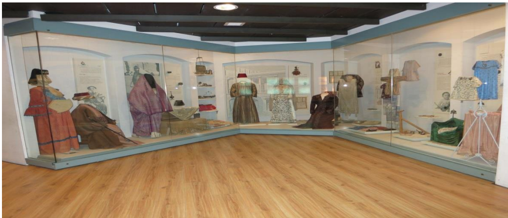
מחזור החיים היהודי מוצג בעזרת שימוש בפריטי לבוש שונים.

מחזור החיים היהודי – אני חי בתוך הקהילה: תצוגת מחזור החיים היהודי מציגה את הפרקים המרכזיים בחיי היהודים בעיראק מן הינקות ועד לזקנה ומתארת את הטקסים והמנהגים שהתקיימו סביב הלידה, הילדות, בר המצווה החינה, החתונה והזקנה. בתצוגה מערכות לבוש מסורתיות, תכשיטי כסף וזהב, כלים, תמונות ופריטים נדירים ביופיים שמקורם בעיראק. התצוגה ממחישה מנהגים ומסורות בתחנות חשובות בחיי יהודי עיראק, מהמחצית השנייה של המאה ה-19 עד המחצית הראשונה של המאה ה-20.