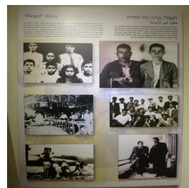
תצוגת תמונות בנושא העפלה

הקליטה : יהודי עיראק, שעלו בהמוניהם בשנותיה הראשונות של מדינת ישראל, אולצו לוותר על אזרחותם העיראקית. הם הגיעו למדינה הצעירה כפליטים עם מזוודה אחת ושוכנו במעברות. תצוגת הקליטה מציגה בפני המבקר באמצעים אינטראטיביים את תהליך קליטתם של יהודי עיראק במדינת ישראל, תוך שימת דגש על תחושותיו של הפרט. את הכניסה לחלל התצוגה מקדים גשר, עליו צועד המבקר, הממחיש את המסע שעברו העולים בדרכם ארצה.