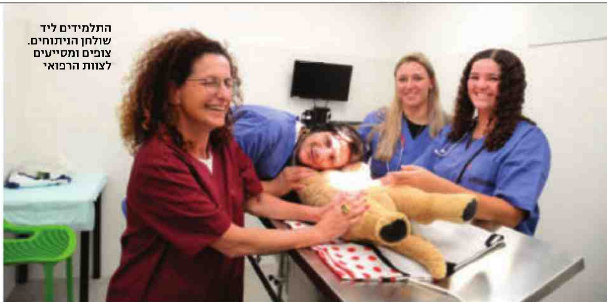
התלמידים ליד שולחן הניתוחים. צופים ומטייעים לצוות הרפואי