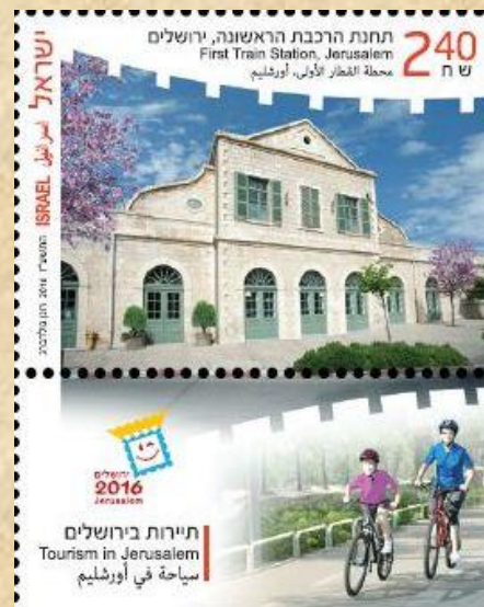
מחטת (א)לקטאר פי אורשלים