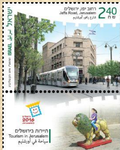
שאָרע יאפא פי אורשלים