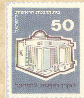
דאר (א) לחאמ'אמי'ה (אל) ר'אסי'ה