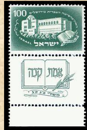
אלג'אמעה (א) לעבריה