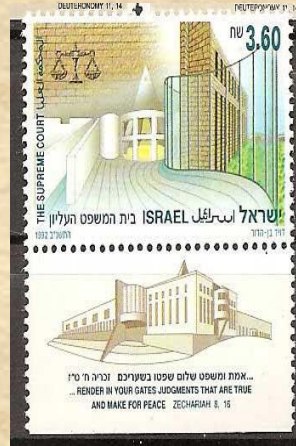
אלמחכמה (א) לעליא