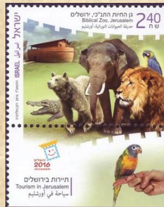
מדיקת (א)לחמיאנאת (אל)ת'וראתי'ה