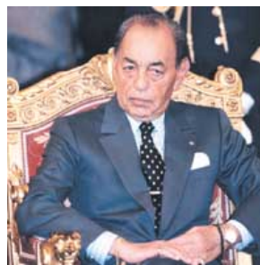
מלך מרוקו המנוח, חסן השני. 8

הסהרה, מהווים מקומות אידיאליים לצמיחתם של תאים טרוריסטיים. כך מתאפשר לתאים אלו לחמוק מרשויות החוק, כוחות המשטרה והצבא באלג'יריה. המערב ובראשו ארצות הברית ומדינות מערב אירופה חייבו את אלג'יריה להילחם בגלוי כנגד תאים אלו.