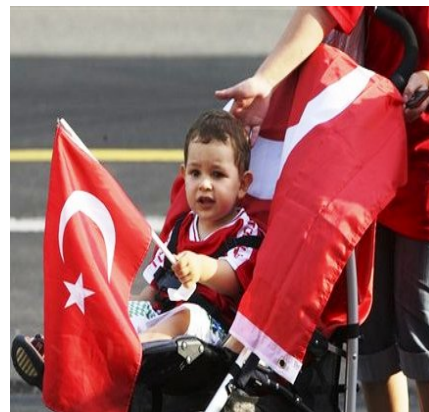
הדור הבא של נבחרת תורכיה 2

המשפט הזה אינו לקוח מתוך מסמך תיעודי העוסק בעמדתה של תורכיה במלחמת העולם השנייה, אלא מתוך כתבה ממדור הספורט של עיתון הארץ. 1 המוטו של משחקי היורו 2008 היה: "Expect Emotions". בשטח, הנבחרת היחידה שהצליחה באמת לרגש, היתה הנבחרת התורכית. מה באמת קרה לתורכיה, ששלחה נבחרת לא מועדפת, שאף אחד לא ציפה שתעלה אפילו לשלב רבע הגמר?