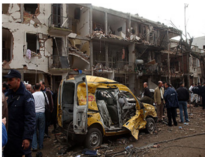
תמונה מזירת הפיגוע, שבו נהרגו 17 עובדי או"ם בתאריך 11 בדצמבר 2007. 7

החשודים העיקריים בתכנון הפיגועים היו תאים של טרוריסטים פעילי אל-קאעידה, המכנים עצמם, לוחמי הג'יהאד במגרב המוסלמי. אלו תאים קטנים אשר חבריהם הינם יוצאי התנועה המיליטנטית האסלאמית באלג'יריה, התנועה הסלפית למען המאבק וההטפה . תנועה זו גייסה צעירים מקרב השכבות החלשות באוכלוסייה, בעזרת תעמולה אסלאמית שהוכתבה על ידי השייח' עבאסי מדאני. 6