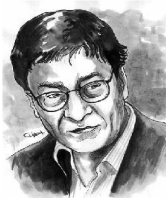
מחמוד דרויש 1942-2008 1

כְּשֶׁהָאֶתְמוֹל נֶעְצַר לְיָדַי אָנִי אוֹמֵר לוֹ: לֹא לְהַיּוֹם קִבְעֵנוּ. לֶךְ עִכְשָׁיו, וְתִבּוֹא מָחָר