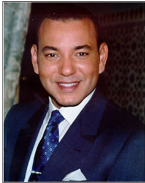
המלך מחמד השישי 7

תקדים כלפי המלך הצעיר וחסר הניסיון של מרוקו. התיזה העיקרית של טוקואה, המגובה בעדויות ואנקדוטות רבות מתוך הארמון וממערך הממשל, היא שבזמן שהמלך המרוקני עסוק בבניית תדמיתו החיובית בעיני המערב, הוא מאבד בהתמדה את אחיזתו בממשלה ובמינהל.