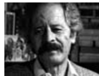
מחמד שְכרי (1935-2003). 5

הספר, שתורגם ליותר משלושים שפות הפך לרב מכר ברחבי העולם. ואולם דווקא במרוקו אסרו חכמי הדת ורשויות החוק על פרסומו עד שנת 2002. לטענת רשויות האכיפה הספר הציג את החברה המרוקנית כאלימה, אלכוהוליסטית, והומוסקסואלית ובכך פגע בתדמיתה. הצנזורה המקומית אף ראתה בחומרה את הביקורת הקשה שהטיח הסופר באביו. בעיני אנשי הדת הביקורת שהופנתה כלפי האב היתה ביטוי נוסף לביקורת שלו על החברה הפטריאכלית במרוקו, ולפיכך אסרו על פרסום הספר.