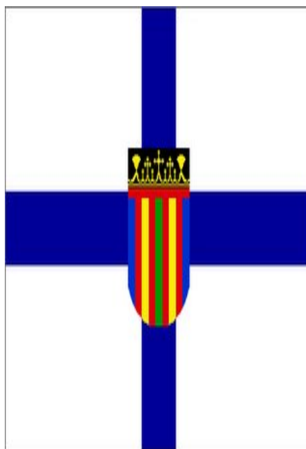
הדגל הלא רשמי של הקופטים

מלבד הפגיעה הפיזית, בני המיעוט הקופטי חשופים גם לאפליה קשה ולהפרה של זכויות האזרח מצד השלטונות. למשל, בניו של קופטי שהתאסלם, אינם רשאים לרשת את נכסיו של האב. מנגד, מוסלמי שהחליט להתנצר מאבד גם כן את זכות הירושה ואף את החזקה על ילדיו. בנוסף, מופלים הקופטים בפוליטיקה המצרית; הפרלמנט נחלק לשני בתים: העליון והתחתון. הבית העליון – "מועצת השורא" – מורכב מ-264 צירים. 174 מהצירים נבחרים באופן ישיר ואילו ה-88 הנותרים מתמנים על-ידי הנשיא. הבית התחתון – "אסיפת העם" – מורכב מ-454 צירים. 444 מהם נבחרים באופן ישיר והעשרה הנותרים מתמנים על-ידי הנשיא. לאור האחוז הגבוה יחסית של הקופטים באוכלוסייה המצרית ומבנה הצירים בפרלמנט המצרי, היינו מצפים לראות ייצוג נאה לעדה, אולם לא כך הם פני הדברים. ישנם, בסך-הכול, שני שרים ממוצא קופטי בקבינט המצרי.