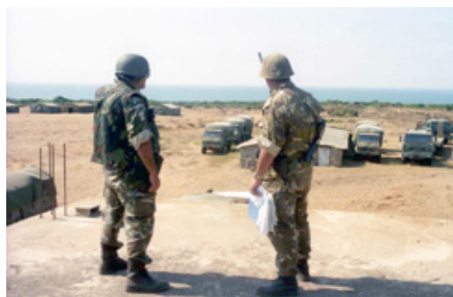
אל חי'בר (24 ביולי, 2008)

מתנועת FIS נוצרו מספר קבוצות נוספות. כך למשל הוקמה הקבוצה האסלאמית החמושה Groupe Islamique Armé (GIA) אשר שאפה לחדש את החילופים. בנוסף חל פיצול ב-GIA, במהלך שנת 1998, והוקמה תנועה חדשה, התנועה הסלפית למען המאבק וההטפה The Algerian Salafist Group for Preaching and Combat (GSPC). התנועה הסלפית היתה הארגון המיליטנטי ביותר ברחבי אלג'יריה. ארגון זה פעל בצורה חמושה וגלויה כנגד הממסד, כוחות הביטחון