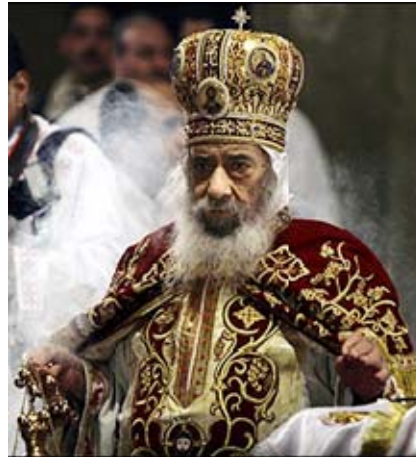
הפטריארך שנודה השלישי 4

הבעת מחאה מצד באבא שנודה השלישי כלפי הייצוג העגום לו זוכים הקופטים ברשויות הממשל המצריות, נשמעה באופן יוצא דופן באוקטובר 2002: