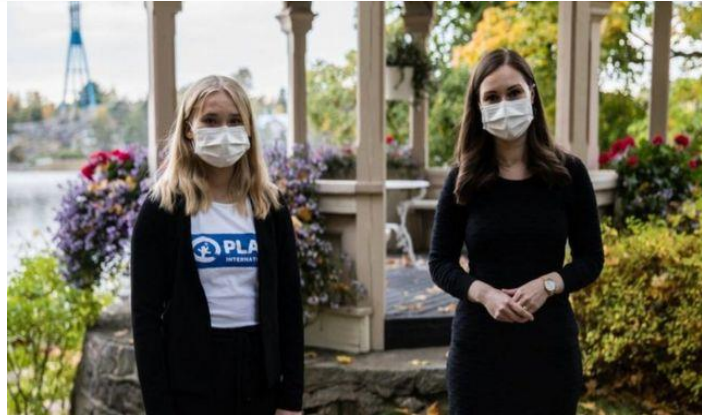
أصبحت سانا مارين رئيسة وزراء فنلندا (على اليمين) أصغر رئيسة وزراء في العالم

أُضْغَطُوا عَلَى الصُّورَةِ وَشَاهَدُوا الفِيلْمَ القَصِيرَ :