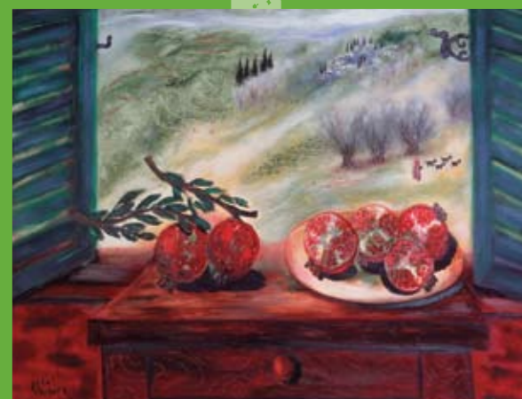
ראובן רובין, רימונים על חלוני, 1967, אוסף מוזיאון בית ראובן.

שמות ט"ו בשבט, ראש השנה לאילן, "חמישה עשר" מועד ט"ו (=15) בשבט רקע היסטורי יום שהתפתח מתאריך הלכתי מימי קדם (תחילת שנת המעשר החקלאית (מעין מס קדום)) עונה לקראת סוף החורף (אמצע החודש, כשהירח במילואו) משמעות הקשר בין העם לארצו, איכות הסביבה, שמירת הטבע מנהגים נטיעת עצים, אכילת פירות יבשים וטריים מארץ ישראל, קיום "סדר ט"ו בשבט", יציאה אל הטבע