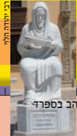
רבי יהודה הלוי