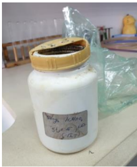
חומרים באריזות לא תקינות הנמצאים בשימוש המעבדה

להלן דוגמאות לליקויים נפוצים, שנמצאו בבקורות במעבדות: