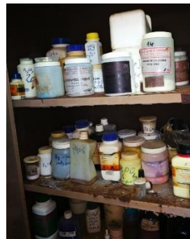
מדפים חלודים עקב דליפת חומרים מסוכנים