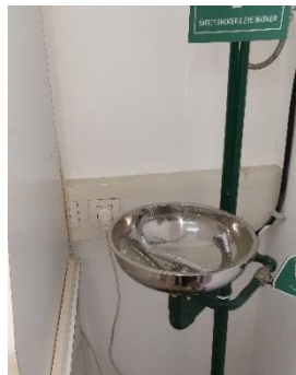
התקנה מסוכנת של משטפת עיניים בקרבת שקע חשמל