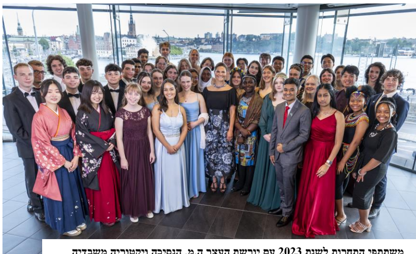
משתתפי התחרות לשנת 2023 עם יורשת העצר ה.מ. הנסיכה ויקטוריה משבדיה

התחרות הבינלאומית של פרס המים של שטוקהולם לנוער מתקיימת בשבדיה מידי שנה בחסות בית המלוכה השבדי ומאורגנת על ידי מכון המים הבינלאומי של שטוקהולם (SIWI) במסגרת אירועי שבוע המים הבינלאומי. התחרות מקבצת את המדענים הצעירים הטובים ביותר ברחבי העולם ומדרבנת התעניינות מתמשכת שלהם בנושא המים והסביבה. בתחרות שנערכה השנה השתתפו 45 מדענים צעירים שייצגו 29 מדינות מרחבי העולם והציגו את הפתרונות היצירתיים שלהם לאתגרים השונים של משק המים העולמי.