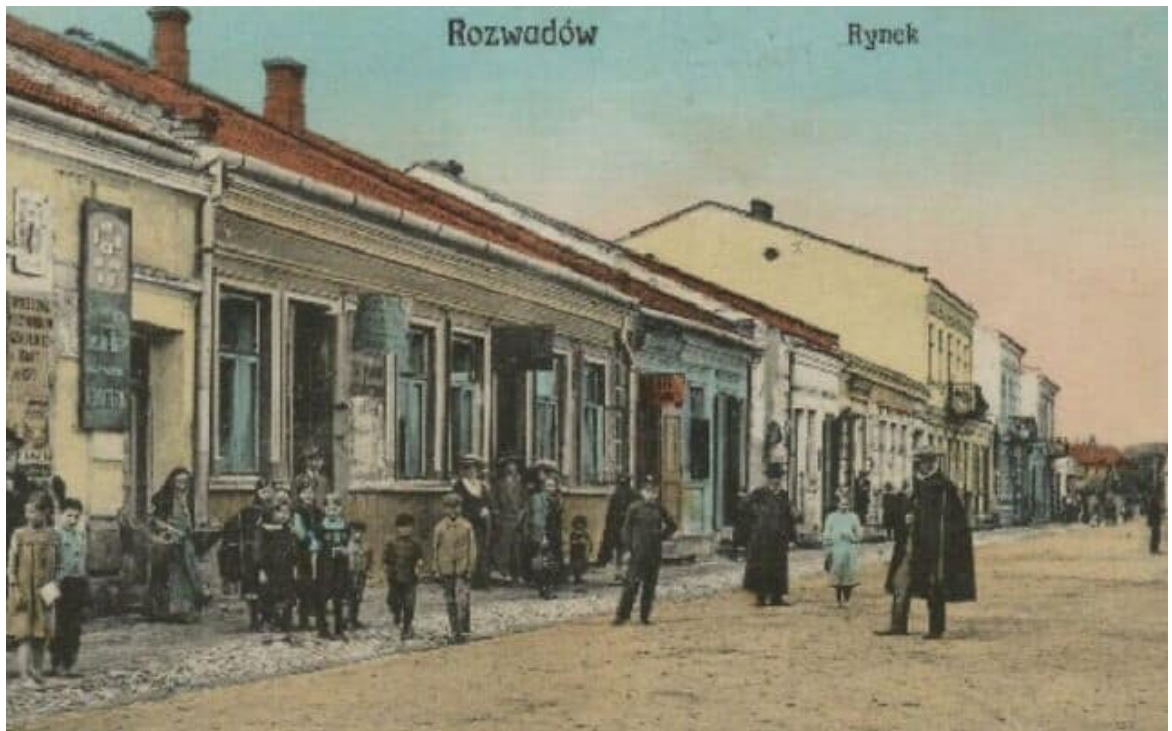
גלויה מפולין של לפני המלחמה, שמתארת את הרחוב היהודי ברוזוודוב (צילום: רשות הציבור)