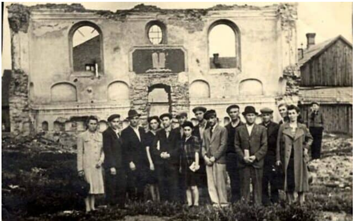
יהודי רוזוודוב בבית הכנסת ההרוס אחרי המלחמה