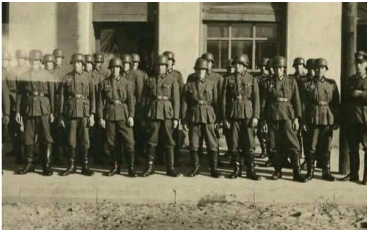
חיילים גרמנים ברוזודוב, פולין