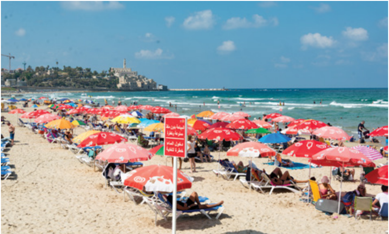
חוף הים (בצילום, בתל-אביב) כמפלט זמני מ"אי החום העירוני" השורר בסביבה העירונית הבנויה