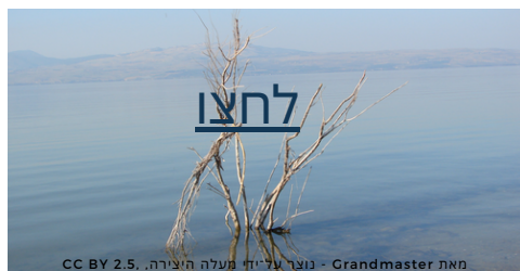
מאת Grandmaster - נוצר על ידי מעלה היצירה. CC BY 2.5. https://commons.wikimedia.org/w/index.php?curid=1440941

בדקנו עם אורי מה התרחש במשק המים בעשור האחרון, שמענו ממנו על הערכות רשות המים למשבר האקלים ותופעות הקיצון ומה אנחנו יכולים לעשות כדי לשמור על המים שלנו. שאלנו את אורי מה הוא מאחל למדינת ישראל מבחינת המים והוא סיכם זאת בשתי מילים "גשם בעיתו"