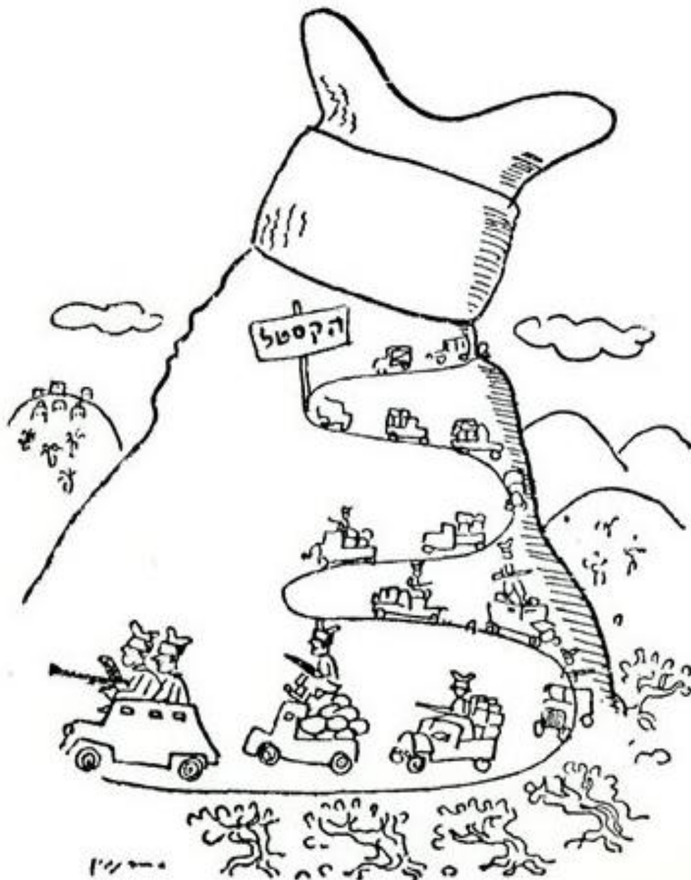
(קריקטורה של אריה נבון לאחר כיבוש הקסטל)