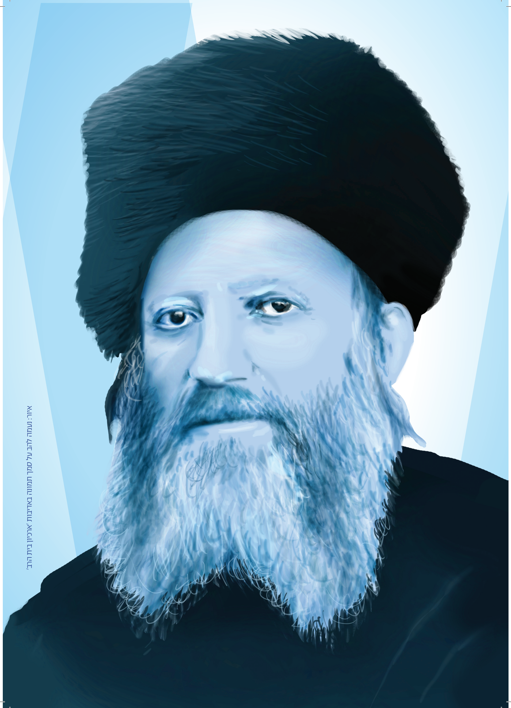
איור: נעמה לוז על סמך תמונה באדיבות 'ארכיון בית הרב'