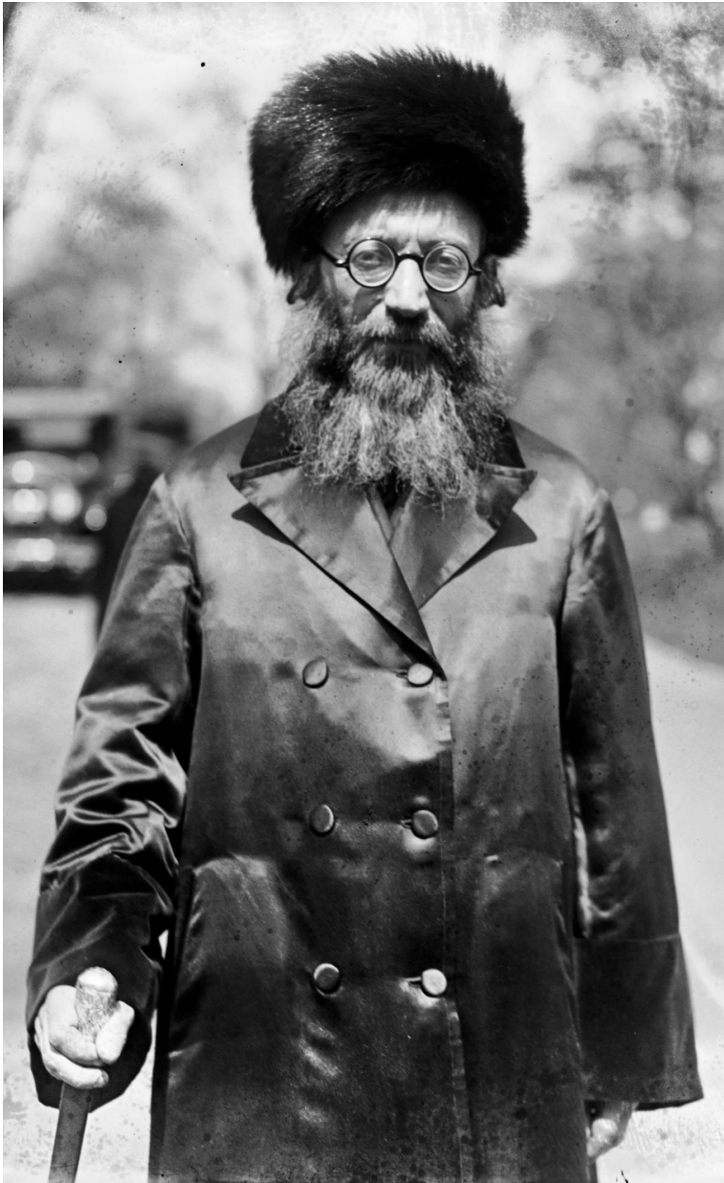
הרב קוק 1924