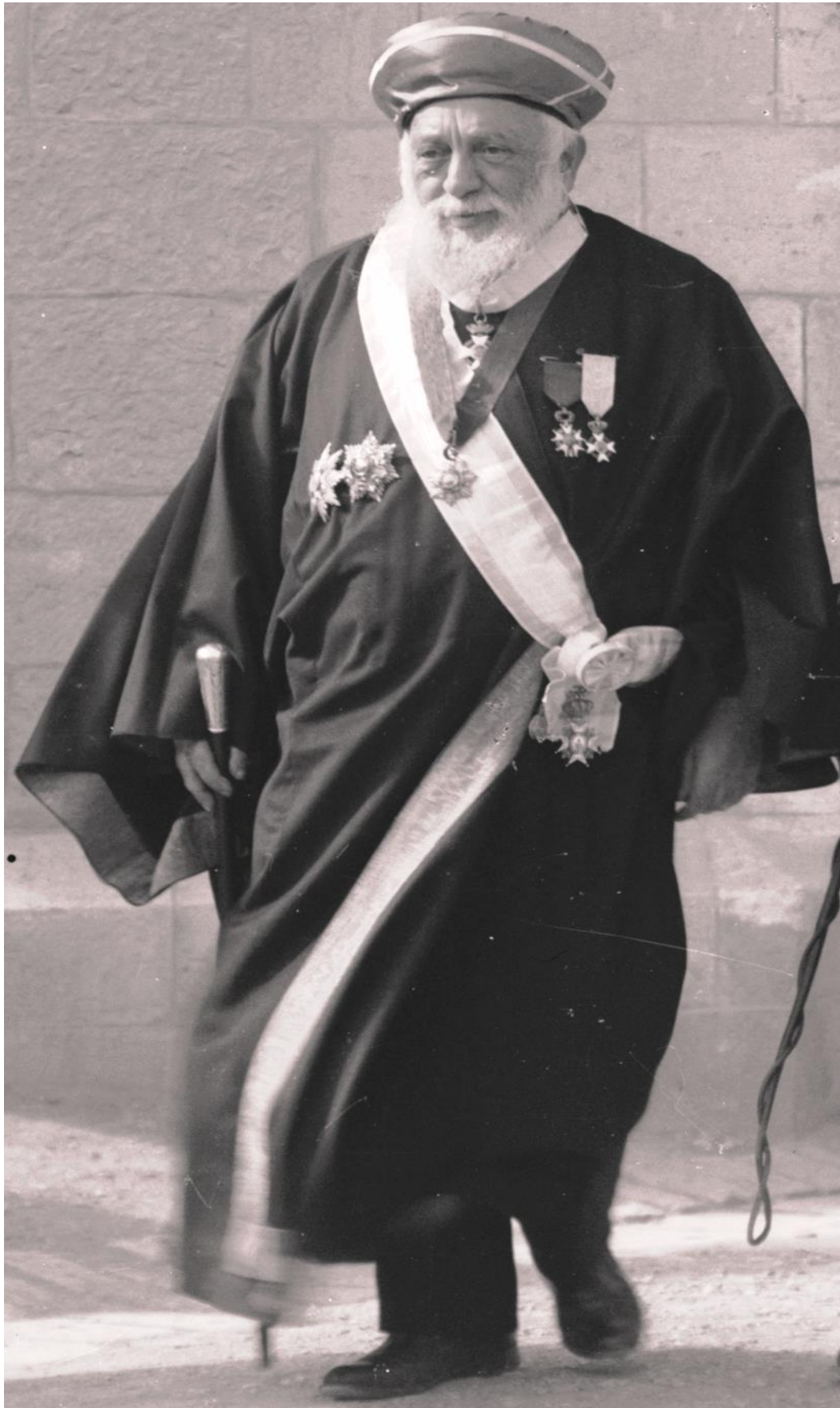
הרב יעקב מאיר, 1936