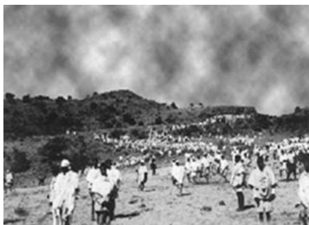
החזרה מטקס הסיגד

העם וה' בספר נחמיה וכן בויקרא כ"ו, ודברים כ"ז-כ"ח. כיוון שה'אורית' הייתה כתובה בשפת ה'געז', שנחשבה למקודשת ורוב העם לא ידע אותה, תרגמו הכהנים את הכתוב לשפה המדוברת, אמהרית או תיגרית. אחר כך כל הקהל מתוודים על חטאיהם, כורעים ומשתחוים בידיים פרושות כלפי מעלה, ובסיום הטקס היו תוקעים בחצוצרות ומביעים את הרצון לחגוג בשנה הבאה בירושלים. לאחר שירדו מן ההר, בסוף היום, היו יורדים בשירה ובריקודים לכפר ומקיימים סעודת מצווה חגיגית החותמת את היום.