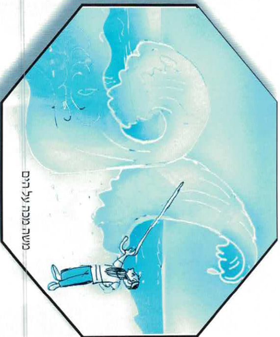
משה מכה על הים

* עבודה בתנועה: בשיחה מקדימה מחלקים את סיפור יציאת מצרים לשלוש תמונות: