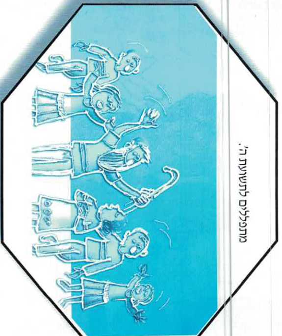
מתפללים לתשועת ה'.

לאחר השיחה מתחלקים הילדים לקבוצות עבודה וכל אחת מהן מבינה (בהנחיית המננת או המורה למוריקה) תמונה אחת. התכנון כולל את רצף התנועות המאפיינות את המתרחש בתמונה. בסיום מוצג הסיפור כולו ברצף כשכל קבוצה נותנת את חלקה. (להעשרה בנושא ראו זלדה רובין, לרקוד את אבותינו, תש"ה, המקורות לעיון.)