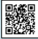
שיר: חמ"ד כמו משפחה