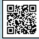
שיר: פתחו את השער