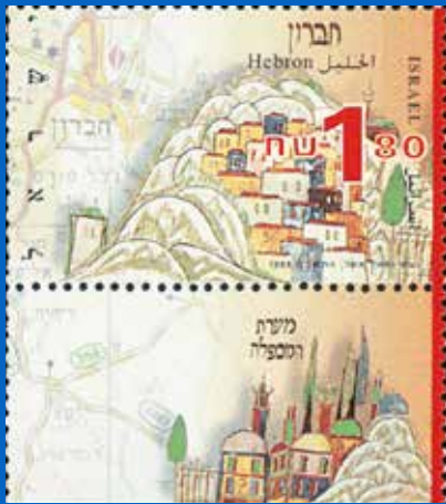
מעצבי הבולים: נעמי ומאיר אשל

זו שאלה קשה, אך מעניין לשמוע את תשובות הילדים.