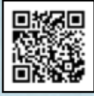
שיר: לך אתן את הארץ הזאת

וּמִבֵּית אֲבִיךָ אֶל הָאָרֶץ אֲשֶׁר אֲרָאָךְ (בראשית יב, א)