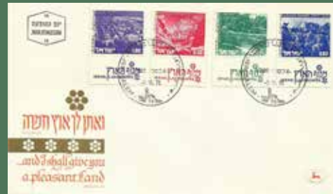
הבולאי - דואר ישראל באדיבות השירות

בפרשת לך לך מתגלה לראשונה הקשר המיוחד שבין עם ישראל לארץ ישראל. אברהם התודע לארץ ישראל - לא מתוך בחירה שלו - אלא בעקבות ציווי אי-לֹהי. קשר איתן זה, שבין ישראל לארצו, נשמר לאורך כל שנות הגלות, הכיסופים והערגה לארץ המולדת היו תמיד משאת נפשם של יהודים רבים ברחבי תבל.