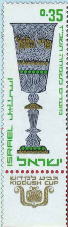
מעצב הבולים: אליעזר ויסהוף

בבית הכנסת מתחילים השבת לקרוא את התורה מבראשית. כדאי כמובן לציין זאת בחגיגה בגן או בקהילה. בפרשת בראשית מתוארת בריאת העולם בששת ימי המעשה. לקראת שבת קודש נתמקד ביום השביעי, שבו שבת איל מכל מלאכתו. ליום השבת כולנו מחכים ומצפים. בשבת מתכנסת המשפחה כולה סביב שולחן השבת, יש בה מנהגים אהובים וגם זמן פנוי לבילוי משותף עם המשפחה. ההנאה הטבעית של הילדים ביום זה היא הזדמנות טובה לעסוק במקור של יום המנוחה.