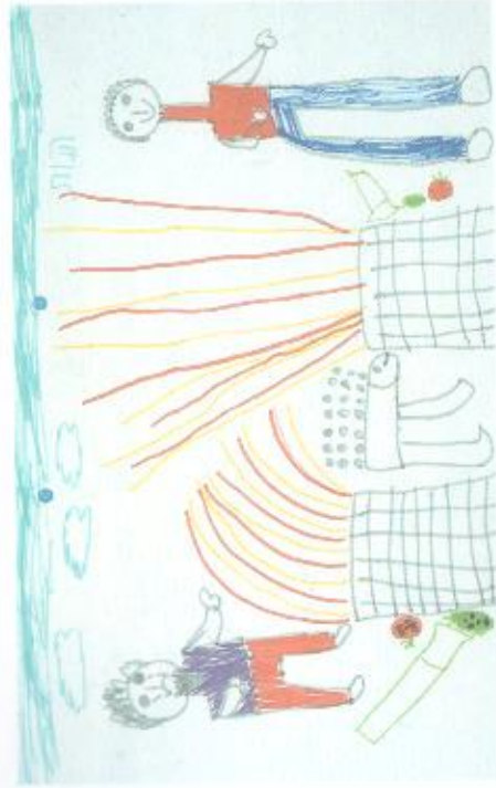
"...ומשע ה' אל הבל ואל מנחתו". צילום הצעיר: בוקי בועז

לשמה וזו השומרי של אחי האם אני צריך להשגח עליו?"